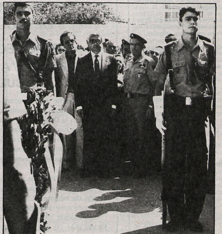
Unidades militares del Ejército de Tierra rinden honores durante el traslado

En este momento yo entrego a la parroquia de Nuestra Señora de la Asunción los restos de nuestro más precla-