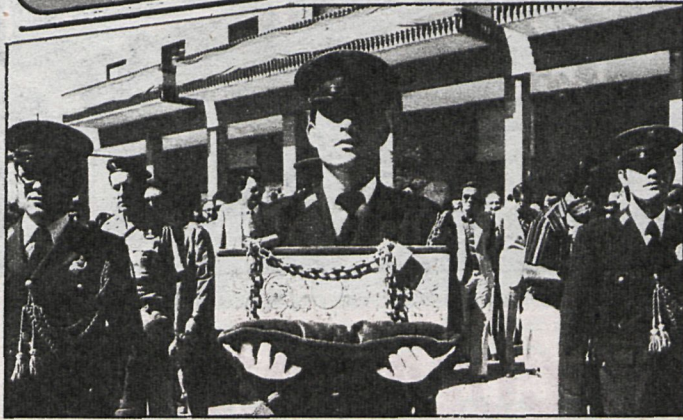
La urna de cerámica, conteniendo los restos de Andrés Torrejón, sale del Ayuntamiento en manos de un agente de la policía municipal

Los restos del legendario alcalde de Móstoles, trasladados en una solemne ceremonia a su definitiva morada