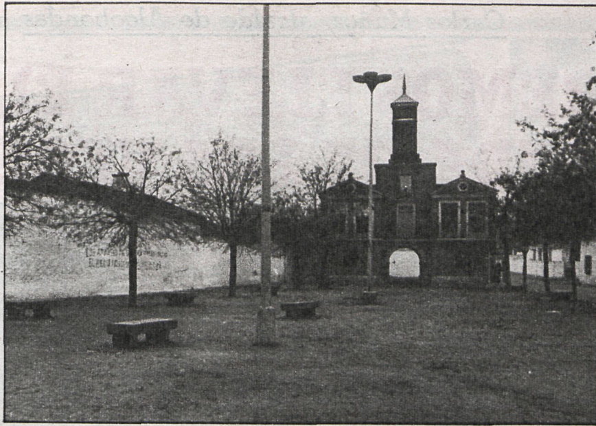
El Ayuntamiento de Camarma, en un callejón sin salida

Deportes, actos religiosos, bailes, concursos y actuaciones musicales se celebrarán durante estos días. Habrá también novilladas y vaquillas y el día 21 el Ayuntamiento ofrecerá un vino de honor gratis a todos los vecinos.