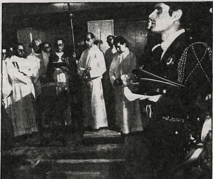
Los restos del héroe de la Independencia, ya en la iglesia de Nuestra Señora de la Asunción, donde el cura párroco pronunció un responso

Antes de introducir la urna que contenía los restos en el templo parroquial, una compañía del Ejército rindió honores militares a Andrés Torrejón, y a continuación Bartolomé González pronunció un breve e improvisado discurso en el que, entre otras cosas, dijo: «Hoy, el pue-