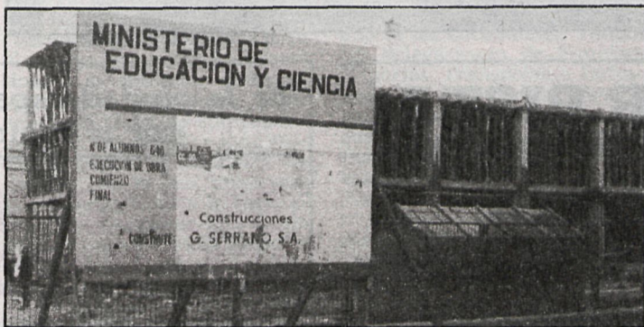
Algunos centros de la periferia no han terminado sus obras en el plazo previsto