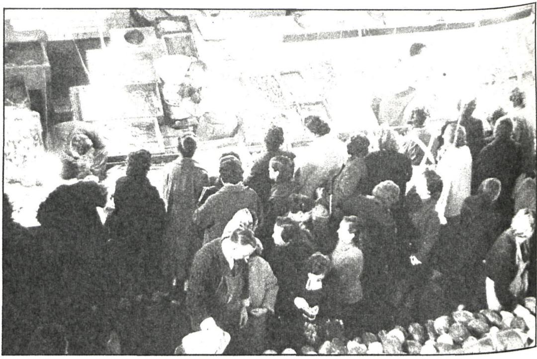
El nuevo mercado romperá los moldes de los que existen en la actualidad

—Estará situado entre la carretera de Villaverde y la avenida de Gibraltar. La parcela