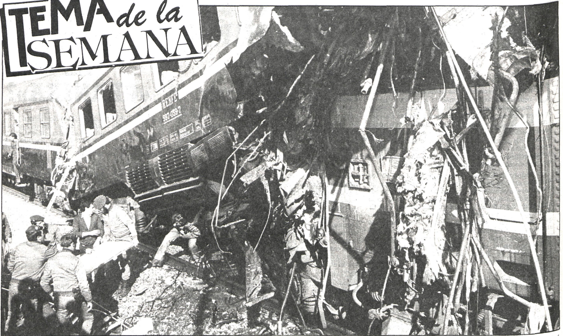
Accidentes como el ocurrido el pasado año en Miraflores, que vemos en la fotografía, son un auténtico «test» para probar la capacidad de reacción de los servicios de Protección Civil. ¿Qué ocurriría si el siniestro fuera de mayor magnitud?

No existe una coordinación entre la Administración y los municipios para actuar conjuntamente en caso de emergencia