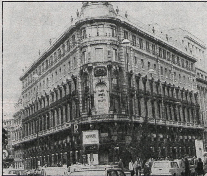
Los depósitos se acumulan en los distintos bancos para su posterior distribución a otras zonas del Estado