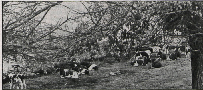
La nueva remesa de piensos llegará de inmediato a la ganadería de nuestra región

Con el fin de facilitar las posibilidades de financiación, es importante el acuerdo adoptado por la Administración sobre los créditos a que se puede acceder únicamente con el aval de dos fiadores. Mientras que hasta la fecha en todos los créditos del SENPA sólo se exigía la firma de dos fiadores hasta un tope de 750.000 pesetas y a partir de esta cifra el