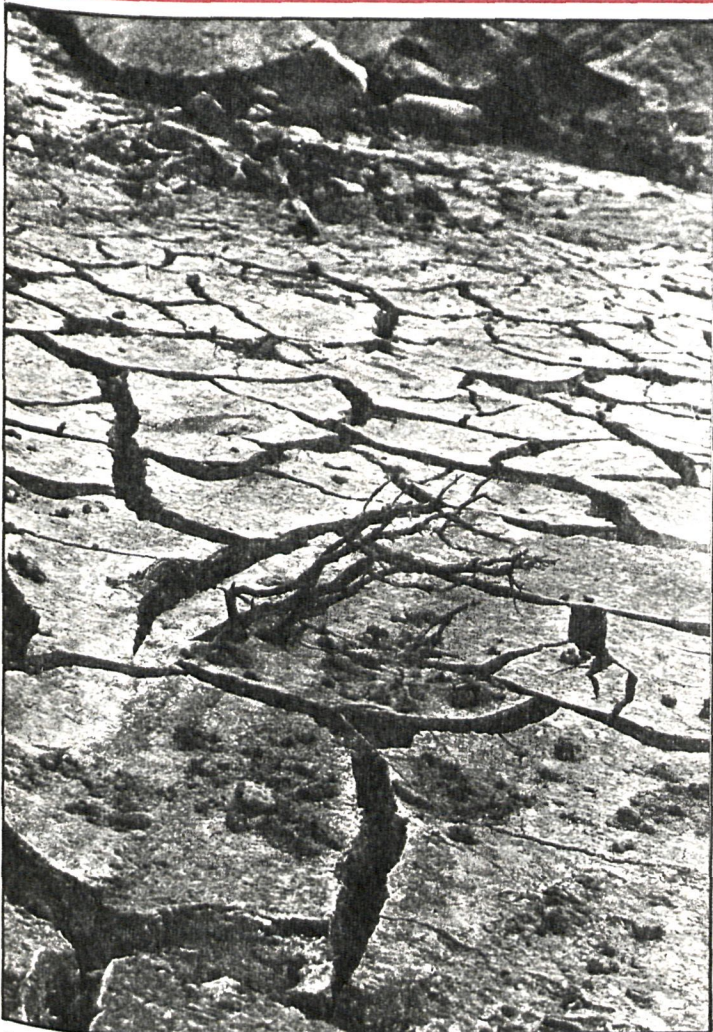
Hasta la llegada de las lluvias y nieve salvadoras, el 10 de diciembre, la perspectiva dantesca de nuestros embalses era la que muestra la fotografía. El ganado e incluso el abastecimiento normal para las necesidades humanas peligraron seriamente, como nunca en el presente siglo