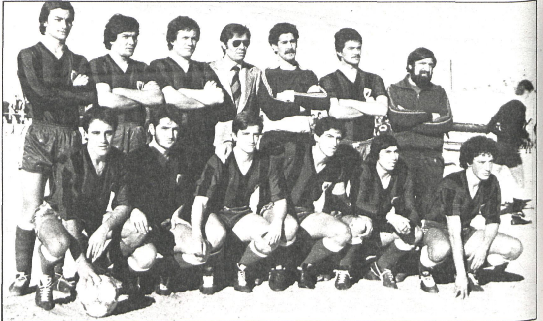
La plantilla del Parla tendrá que pasar este fin de semana su reválida frente al Alcorcón

REAL AVILA-MOSCARDO. — Pocas esperanzas de vic-