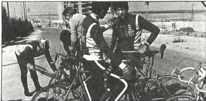
La afición por el deporte de las dos ruedas se extiende por la provincia. En la foto, ciclistas de San Sebastián de los Reyes, municipio que, junto a Torrelodones, está dando un gran impulso a esta actividad

El domingo día 3 se celebró en Torrelodones el II Ciclocross Sierra de Madrid, patrocinado por el Ayuntamiento y organizado por el club ciclista Sierra de Madrid. Es una actividad típica de la época, que se prodiga en los pueblos de la provincia junto a las carreras atléticas populares