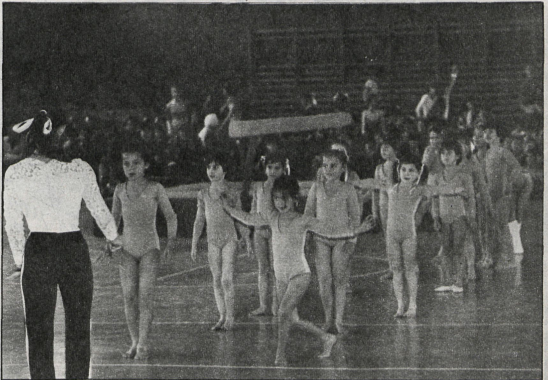
Los más peques hicieron las delicias de los cientos de asistentes al polideportivo de Moratalaz

junto de acrobacia al compás de la música, que resultó muy vistoso y de un gran colorido. Después, y como colofón, se realizó un desfile de todos los participantes. El público asistente, unas 1.000 personas, aplaudió en todo momento las acciones de los gimnastas, en especial las de los más pequeños. Se dieron medallas a todos los participantes, también la Escuela Deportiva Municipal de Majadahonda obsequió a su