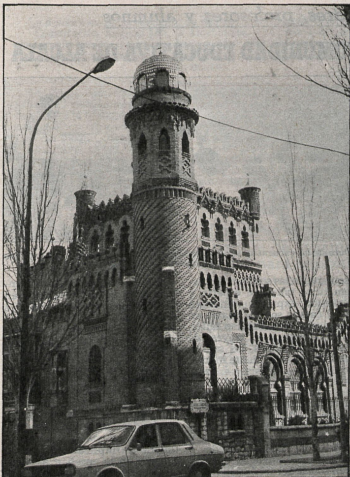
La huella árabe se aprecia en numerosos municipios españoles, y en la actualidad se va a ver acrecentada con el nuevo centro cultural