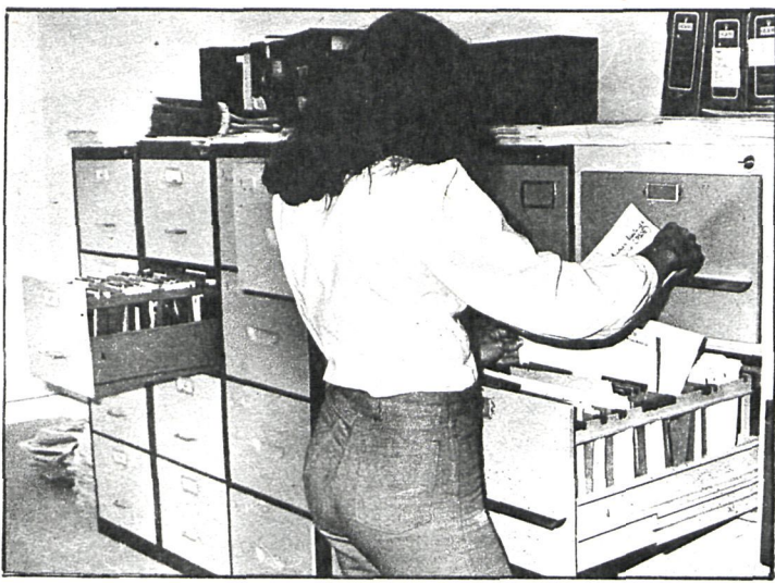
El adecuado funcionamiento de la Administración pública exige, en ocasiones, la adopción de medidas sancionadoras

Un técnico de administración de Alcobendas tiene abierto expediente por simultanear dos trabajos, ocultándolo a la Corporación