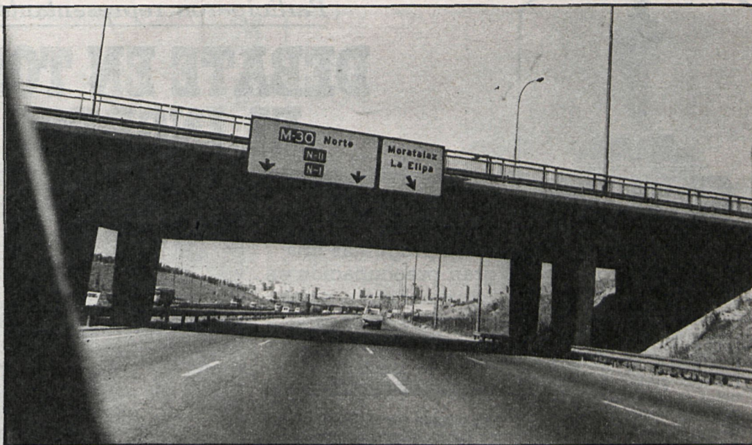
La autopista urbana M-30 va a ser el escenario del importante centro cultural islámico

En la próxima primavera serán definitivamente adjudicadas las obras del Centro Cultural Islámico que se va a construir en Madrid, al borde de la M-30, frente a la torre de televisión de la calle O'Donnell. El inicio de las obras estaba previsto, en un principio, para el verano pasado, y la primera piedra iba a colocar el Rey Jaled de Arabia Saudí, principal promotor del proyecto, pero cambios en la Embajada de este país han retrasado todos los planes. Este centro, que puede estar terminado este mismo año, será, sin duda, el más importante del mundo