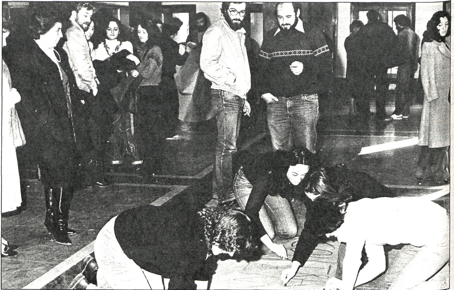
Los profesores, durante el encierro, que tuvo lugar en los locales de la Escuela Normal de Magisterio

■ Sin embargo, y a pesar de reiterar que no se trata de una escisión, no descartó la hipótesis «de que nos planteemos ofrecer una opción fuera del actual PCE con la creación de otro partido si se sigue con la ineptitud de la dirección y no se actúa por la reconversión». Esta reconversión pasaría por el abandono de los planteamientos socialdemócratas de la dirección, la continuación del estudio ideológico dentro del partido, proceder a una política de movilizaciones de masas y reconsiderar los actuales métodos de trabajo con el abandono del dirigismo y el burocratismo.