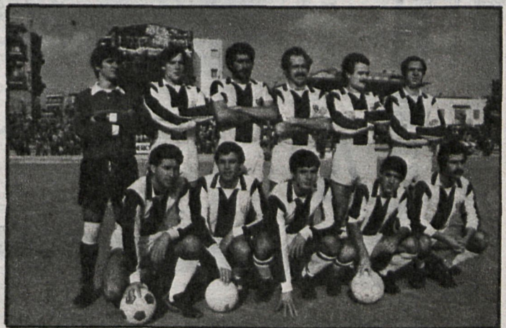
Actual formación del Leganés, equipo que con altibajos mantiene unas posiciones en progresiva mejora

■ Alcobendas-Conquense, San Fernando-Ciempozuelos, Móstoles-Pegaso y Atlético de Pinto-Talavera, con tintes de dramatismo en una lucha por salir del fondo de la tabla