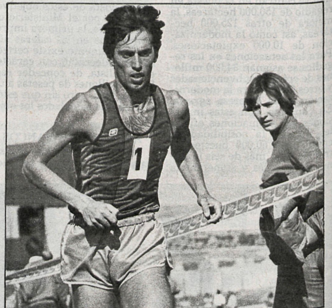
Este es el premio especial. Su título, «La mirada»