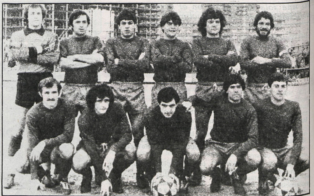
El San Fernando, en otro partido de interés esta semana, visita a los chicos del Pegaso, en un ambiente de máxima rivalidad

Tras su victoria frente al Conquense, vuelve a recobrar la esperanza de salir de la cola, aunque tendrá que emplearse a fondo si quiere batir esta semana al Real Avila