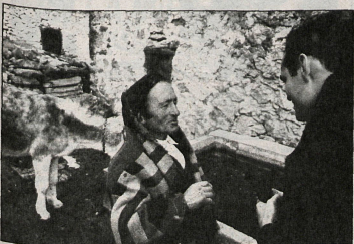
Los préstamos ayudarán a elevar el nivel de vida en el campo

es compartida por varias organizaciones agrarias, aunque reconocen que todo dinero barato para el campo debe ser aco-