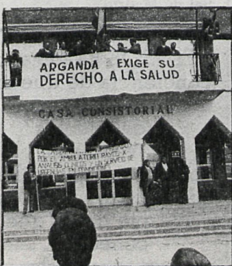
El Ayuntamiento de Arganda, en unión de las fuerzas sociales, promovió el acto de protesta.

A pesar de las reiteradas promesas de construcción por parte del Instituto Nacional de la Salud, que llegó a destinar el pasado año 30 millones de pesetas para su ejecución, la partida se «perdió inexplicablemente», lo que supuso, una vez más, la ruptura de una promesa y la demora en la satisfacción de una necesi-