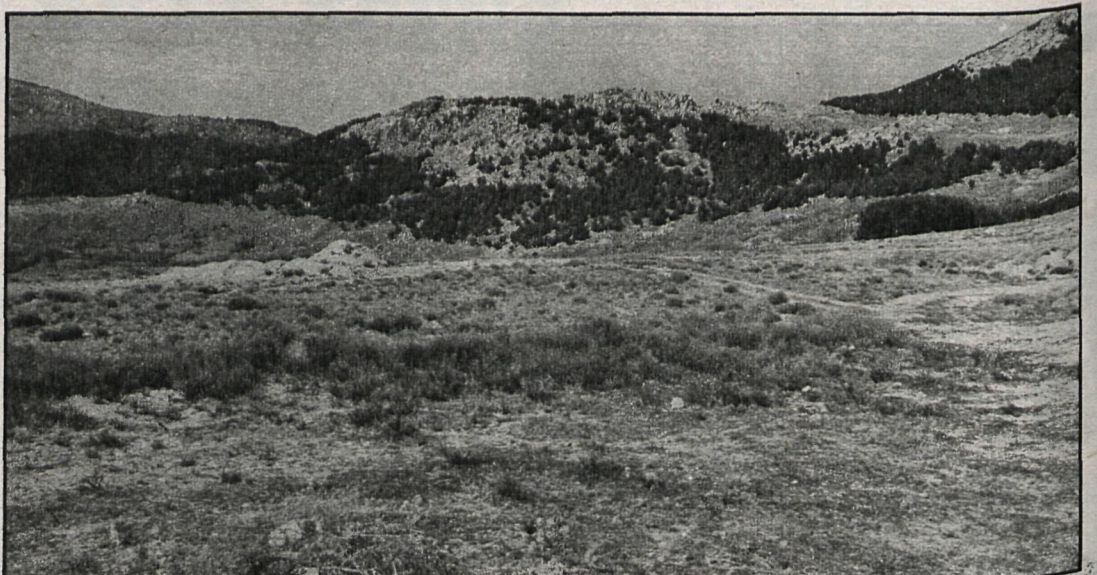
Este es el valle de Bustarviejo, cuya urbanización ha dividido a los vecinos del pueblo

Hacia mediados del pasado mes de febrero la Cooperativa vuelve a insistir para que se apruebe la construcción del polígono. La reunión de las comisiones para tratar el tema se hace a puerta cerrada. El libro de actas donde puede estar, si existe, la aprobación del proyecto, ha desaparecido; en el pueblo se están recogiendo firmas para que los terrenos del valle no se urbanicen. Mientras tanto, el conocido publicitariamente como «Valle de los abedules» sigue asombrando con la variedad de su colorido y el olor a jara.