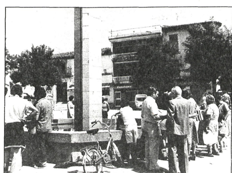
A partir del próximo verano, las fuentes dejarán de convertirse en protagonistas de la información sobre la sierra de Guadarrama