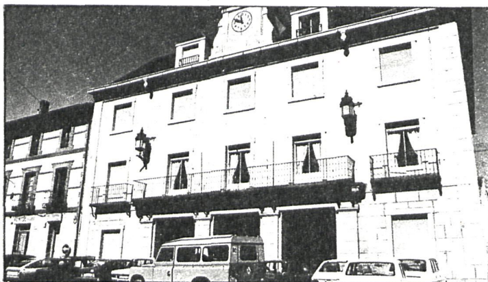
Por su proximidad con Madrid, Cercedilla recibe un volumen elevado de turistas de fin de semana

El aumento progresivo de los madrileños que buscan en los espacios forestales próximos a las grandes urbes una forma de recreo al aire libre ocasiona sin duda un deterioro y una pérdida del patrimonio municipal (desaparición de especies por compartición, reducción de las superficies de pastoreo, disminución de aprovechamientos directos, aumento del índice del peligro de incendios, etc.), que unido a los costes estructurales de adaptación al fin recreativo y los incrementos de los gastos de conservación, limpieza, señalización y otras mejoras ponen en