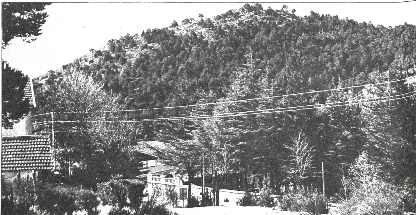
Montes de Cercedilla: para su mejor conservación se han dividido en distintas zonas

También se acordó solicitar subvenciones a la Diputación Provincial de Madrid y al Consejo Superior de Deportes para la construcción de un gimnasio cubierto. Además se acordó solicitar de la Diputación Provincial de Madrid equipamiento sanitario, consistente en un radioscopio-radio-gráfico, una ambulancia, un electro-cardiógrafo, etc.