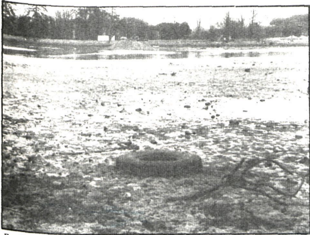
En el fondo del lago se han encontrado los más diversos objetos