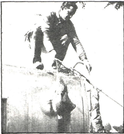
Antes del vaciado del lago se procedió al traslado de más de dos toneladas de peces hasta el estanque del Retiro y los embalses de Valmayor y El Pardo

Las populares «travesías anuales» podrían celebrarse de nuevo tras el saneamiento del estanque