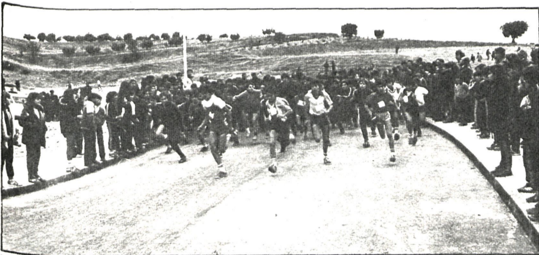
La organización del cross corrió a cargo de la Asociación de Padres de Alumnos y de los Colegios Católicos de Usera

Pronto empezaron las dificultades, ya que la gran cantidad de lodo e inmundicias acumuladas a lo largo de años tapaban en buena medida la compuerta de desagüe. En el fondo se encontraron maniqués, cajas registradoras, sillas, bancos, mesas y otros utensilios de dudosa proceden-