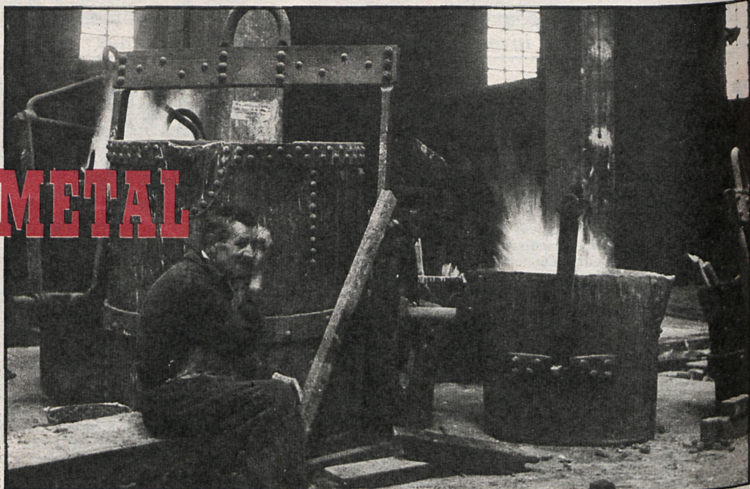
La jornada laboral de los trabajadores del sector en nuestra provincia ha quedado fijada en mil ochocientas ochenta horas

Los resultados de la encuesta de coyuntura del Ministerio de Industria y Energía, correspondiente al mes de enero, reflejan una mejora de la actividad industrial que consolida la tendencia alcista seguida por la trayectoria del ciclo económico en la segunda mitad de 1981.