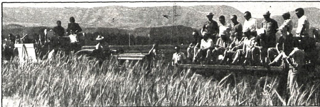
La situación que se está registrando en Madrid en cuanto a las producciones es similar a la de otras provincias

En cultivos de segunda fila, en lo que a superficie se refiere, se ha producido una estabilidad. En avena, las últimas cifras oficiales señalan las 3.000 hectáreas, al igual que en 1981. En centeno se ha mantenido, igualmente, la superficie de 1981 en 2.000 hectáreas.