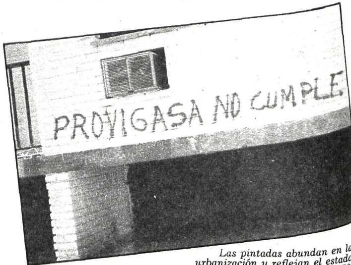
Las pintadas abundan en la urbanización y reflejan el estado de ánimo y peticiones de los propietarios de Ciudad 70.

han servido hasta ahora para muy poco. La situación actual se puede resumir en tres puntos: deficiencias en las vivien-