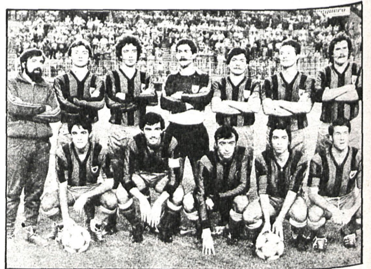
El Parla saldrá esta semana a anotarse nuevos puntos