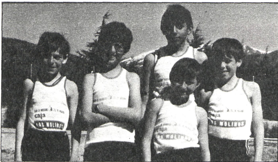
Los jóvenes del pueblo asisten con ilusión a las clases