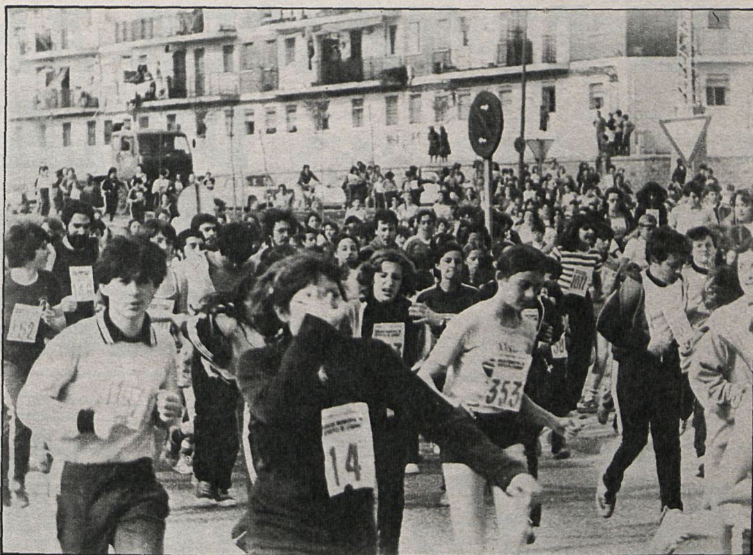
Sólo la mitad de los participantes llegarían a la meta, tras un recorrido de ocho kilómetros

Dentro de un gran ambiente deportivo y festivo, ha tenido lugar la II Carrera Popular de Leganés, que contó con una gran participación. Fueron 3.800 atletas y aficionados los que se lanzaron a las calles. Calles cubiertas de numeroso público, quien a lo largo de todo el recorrido no dejó de animar a los participantes