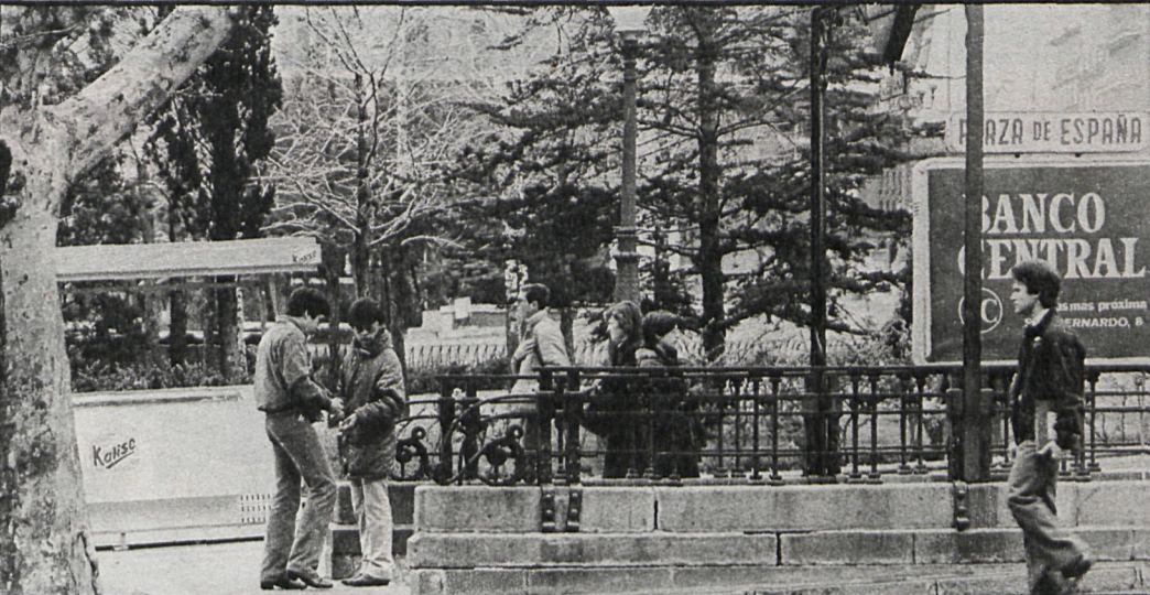
Apostado en la «boca del Metro», el reventa lucha cada día por vender el mayor número posible de billetes, al tiempo que cuida su «territorio» para que ningún otro compañero lo invada

«El Bibi», otro del grupo, ha vendido en más estaciones, y por eso está enterado