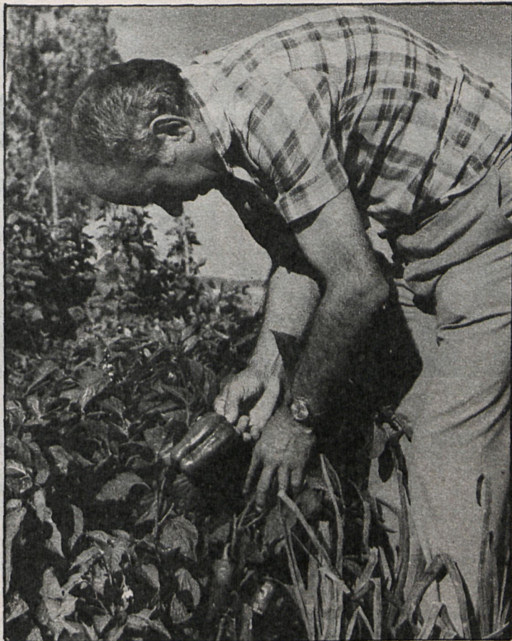
La expansión de los regadíos, que representan en la mayor parte de los casos un importante beneficio para el agricultor, se realiza de forma desigual en el campo madrileño