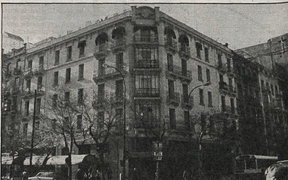
Las comunidades de vecinos tienen a su disposición, a través de esta nueva empresa especializada, desde fontaneros a electricistas, pasando por fontaneros y servicios

Ha de señalarse, no obstante, que de esa cifra global de parados, el 55 por 100 son jóvenes menores de veinticinco años, y que el paro afecta ya al 18 por 100 de la población femenina (14,3 por 100 en 1980) frente a una tasa de paro de los varones