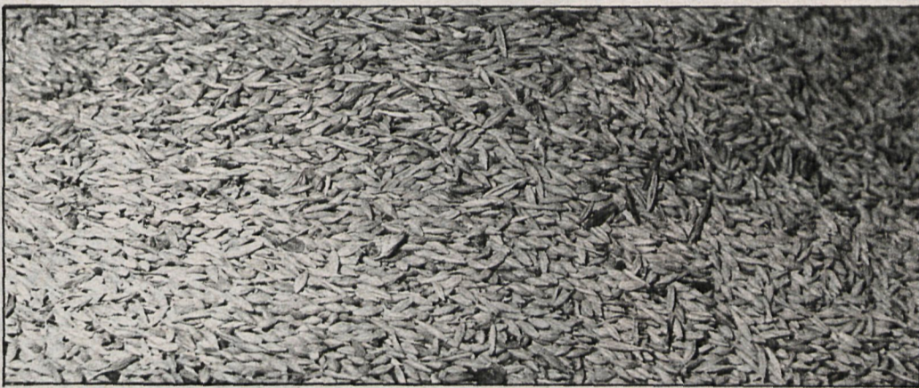
La distribución de los piensos se inició a finales del pasado año

La operación de cereales-pienso se inició a finales de año, pudiendo los ganaderos solicitar el pienso necesario para la alimentación de su ganadería durante cuatro meses. Considerando los efectos positivos de las lluvias de primeros de año y la posibilidad de la existencia rápida de pastos, en febrero la comisión de seguimiento acordó establecer unos mayores controles en la entrega de los piensos. Por este motivo, durante todo el mes de marzo el SENPA únicamente aceptó solicitudes de los ganaderos para cubrir las necesidades de su cabaña hasta el 31