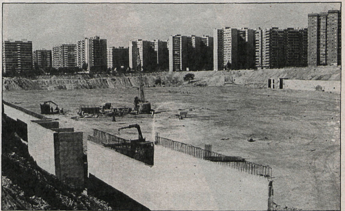
El cierre de la M-30 se realizará en las proximidades de la Vaguada, donde se construye el centro comercial. Centro que, según los vecinos, será el beneficiario de esta autopista