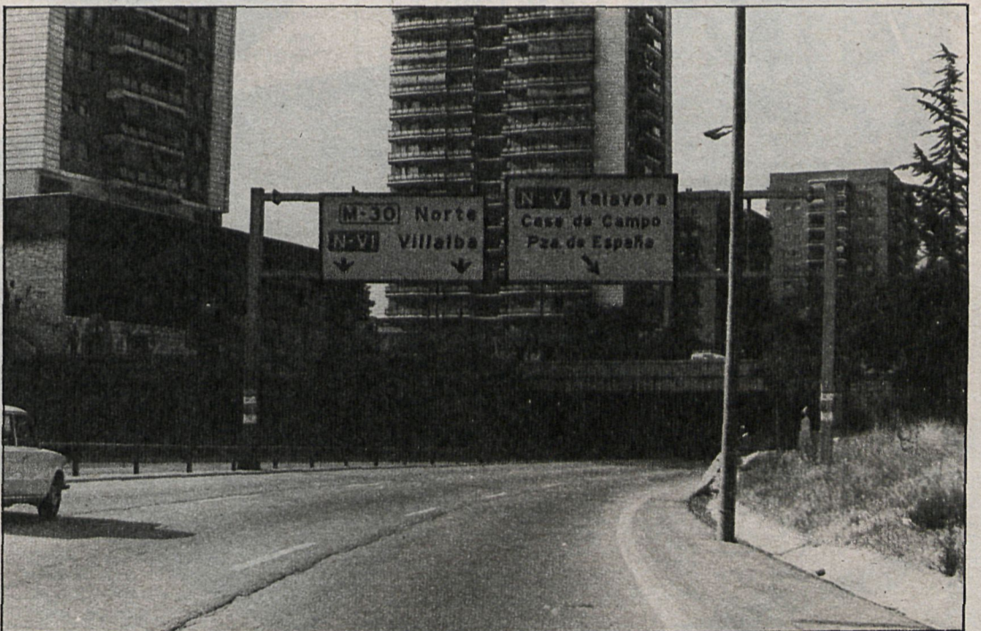
Según los técnicos, el cierre de la M-30 es fundamental para complementar la red viaria de Madrid

que permitirán a los ciudadanos del barrio del Pilar tener un paseo popular. En uno de los laterales, separado por un bordillo, lleva como complemento un carril-bici de tres metros de ancho, por lo que como presidente de la Junta de Fuencarral creo que el viejo problema heredado de la anterior Administración en el primer mandato del Gobierno de izquierdas se le da una solu-