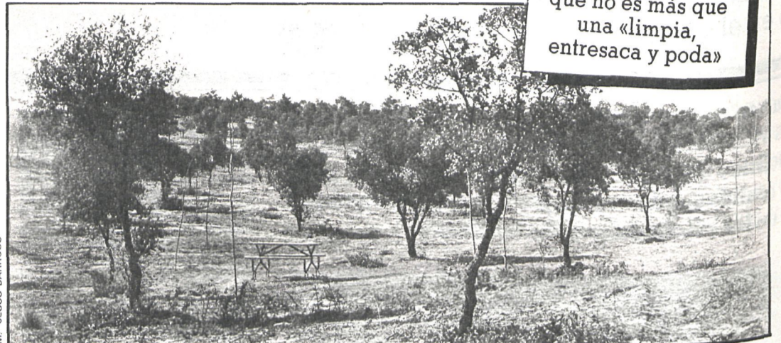
Dehesa Boyal: La corporación niega que se hayan arrancado árboles de gran antigüedad, como afirma la asociación de vecinos

Sin embargo, según ha podido recoger CISNEROS, en fuentes municipales, «la máquina se utilizó porque ahorra trabajo, y daba la escasez de presupuestos —5.000.000 de pesetas— se pretendía acelerar la limpieza de maleza y matorrales, con el fin de evitar in-