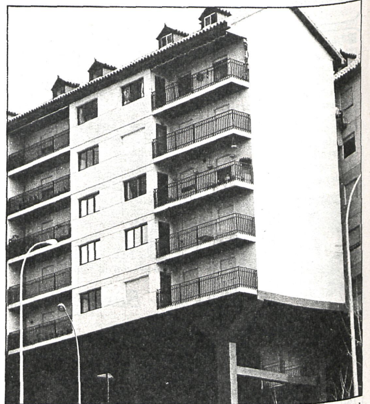
Los propietarios de los pisos de Pryconsa se quejan de la falta de apoyo del alcalde para resolver la situación

En el mismo escrito, dichos concejales denuncian que Construcciones Barbudo ha