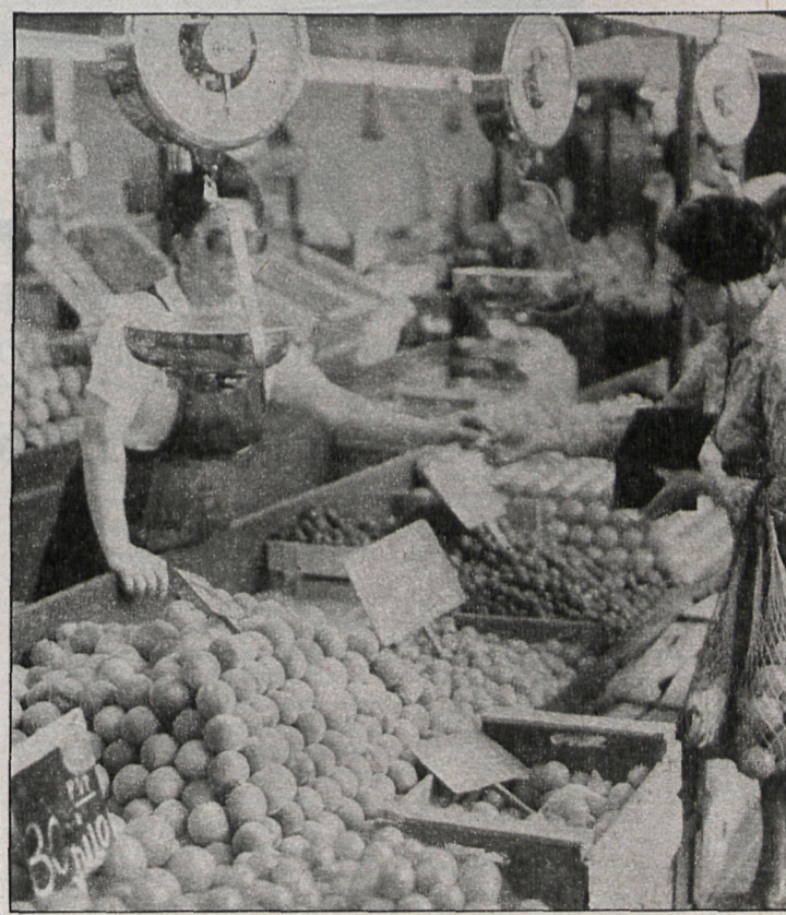
Según el Ayuntamiento, las tasas representan una mínima parte del coste de mantenimiento e inversiones a realizar en el mercado

Si esta solución no llega en un breve plazo de tiempo, «el Ayuntamiento tomará serias medidas».