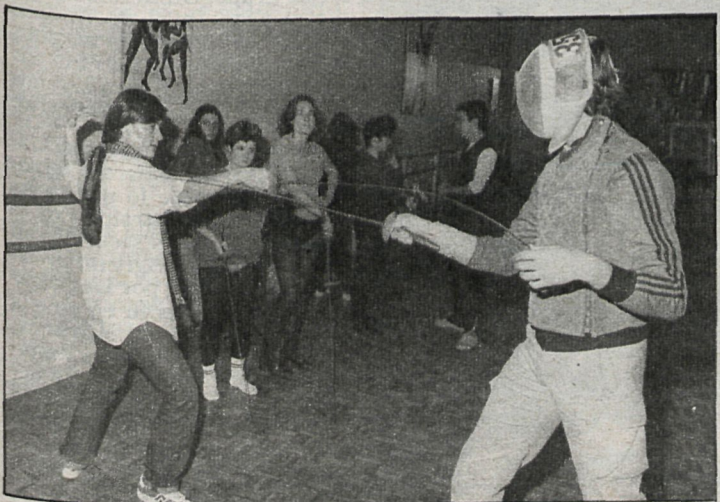
La esgrima es uno de los deportes que podrán practicarse en las nuevas instalaciones