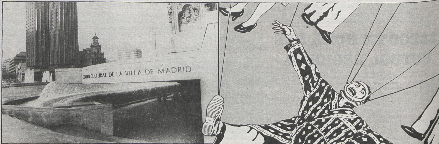
El Centro Cultural de la Villa de Madrid es uno de los puntos en los que se están representando las obras que participan en el festival

Con la celebración del II Festival Internacional durante los meses de abril y mayo