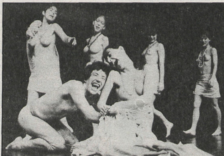
«Macunaima» es el espectáculo que presentan los componentes del grupo brasileño del mismo nombre

La plástica de la obra se basa en la utilización de elementos muy simples que denotan una gran imaginación en la dirección y montaje.