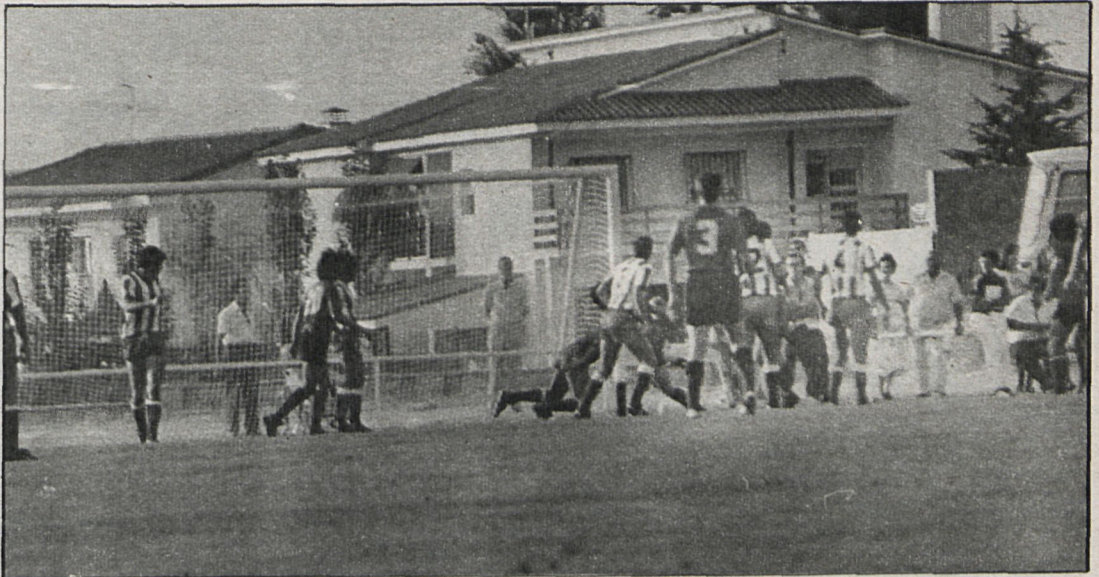
Los aficionados sólo pueden presenciar durante las últimas semanas los encuentros con carácter regional

calidad. Yo creo, no obstante, que ganarán los de casa.