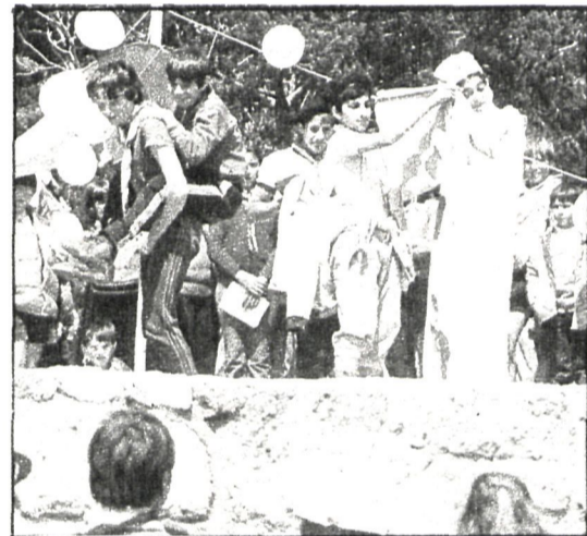
Los jóvenes «scout» católicos se divertieron a sus anchas durante la acampada, que tuvo lugar recientemente en Cercedilla

El movimiento «scout» católico actual data del año 1958, aunque anteriormente ya había desarrollado sus actividades, desde que Alfonso XIII presidió su fundación, en 1912, hasta que éstas fueron suspendidas por decreto, en 1939. Es el más numeroso de las tres organizaciones escultistas existentes en España. En Madrid