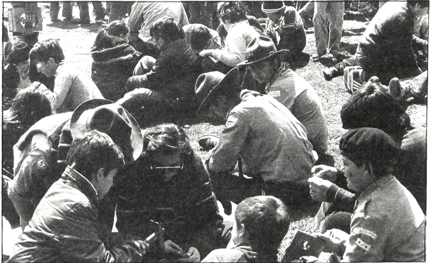
La actividad más conocida de los «scout» son las marchas y excursiones, donde se fomenta el compañerismo entre sus miembros

En Madrid, los «scout» católicos cuentan con 40 grupos, repartidos por toda la región, si bien los más numerosos son los de la capital, Leganés, Getafe y El Escorial