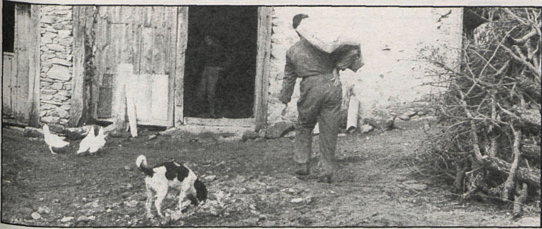
El plan se compone de ayudas para mejorar la infraestructura municipal, al tiempo que se apoya a los particulares en lo que se refiere a pastizales para la ganadería

Ante el escaso número de solicitudes, debido a la falta de información