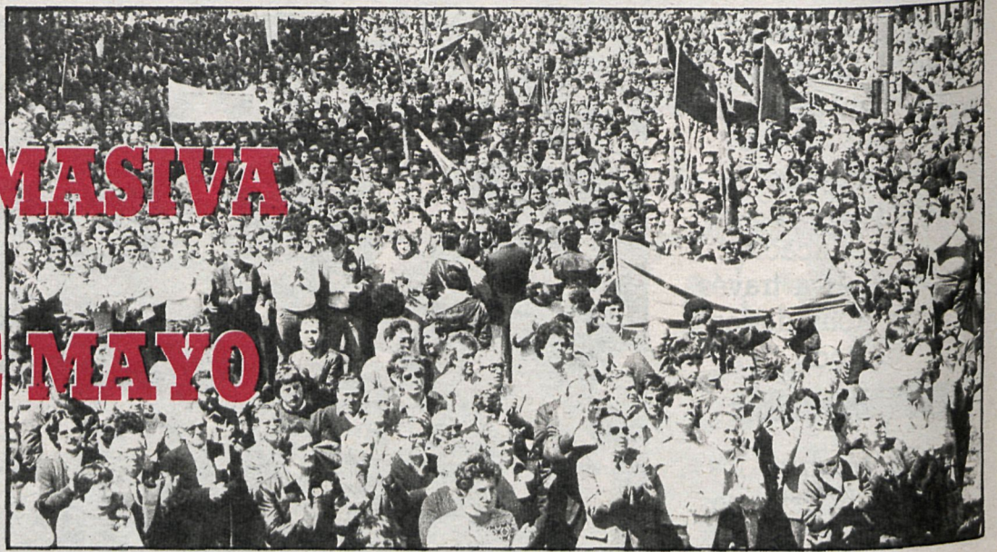
Pese al buen tiempo reinante el día 1 de mayo, los trabajadores madrileños no faltaron a la cita

En Aranjuez, los dos mil asistentes a la manifestación de la mañana, convocada conjuntamente por UGT, CC. OO. y CNT, continuaron la celebración del 1 de mayo con una comida campestre, en la explanada junto al Tajo, donde se había instalado un bar por parte de la comisión de parados. Los juegos, carreras de sacos y otras competiciones pusieron la nota distendida a la concentración.