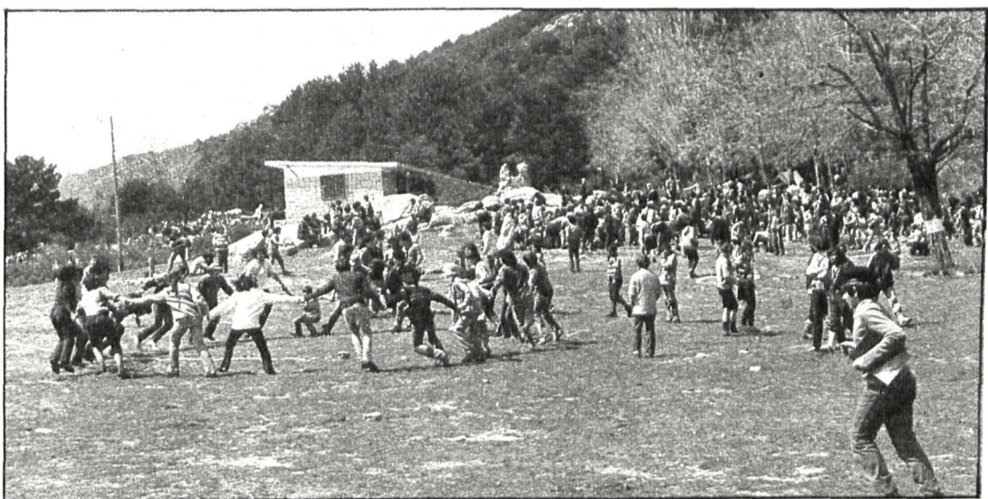
Las numerosas actividades de los «scout» se financian mediante subvenciones oficiales y, sobre todo, aportaciones de sus miembros

cuenta con 40 grupos, repartidos por toda la provincia, siendo más numerosos, aparte de en el propio Madrid, en Leganés, Getafe y El Escorial.