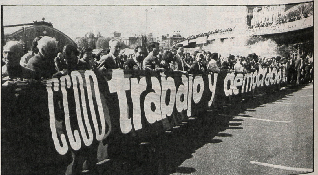
A la cabeza de la manifestación, en una gran pancarta, el lema que coreaban los participantes.