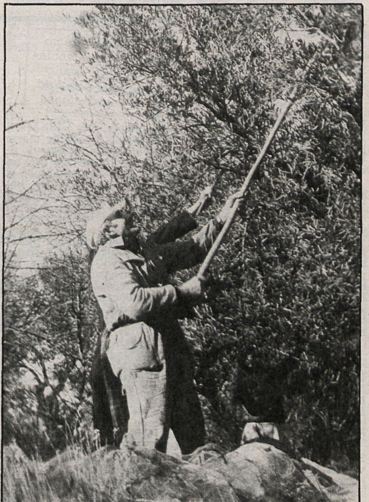
La reconversión del sector olivarero está siendo estudiada actualmente por la Administración y organizaciones representativas

Finalmente, a la hora de aplicar este plan hay que tener en cuenta que es indispensable el que la filosofía contenida en este proyecto responda a la que tendrá la política de grasas, que todavía no está claramente definida. Para muchos olivareros, antes de iniciar este plan se debería haber elaborado una política general de grasas para que esta reconversión fuera simplemente una pieza más del proyecto general. Por este motivo, si se quiere que el plan tenga un máximo de eficacia es preciso dar confianza a los olivareros de que sus mejoras y esfuerzos van a tener una compensación futura.