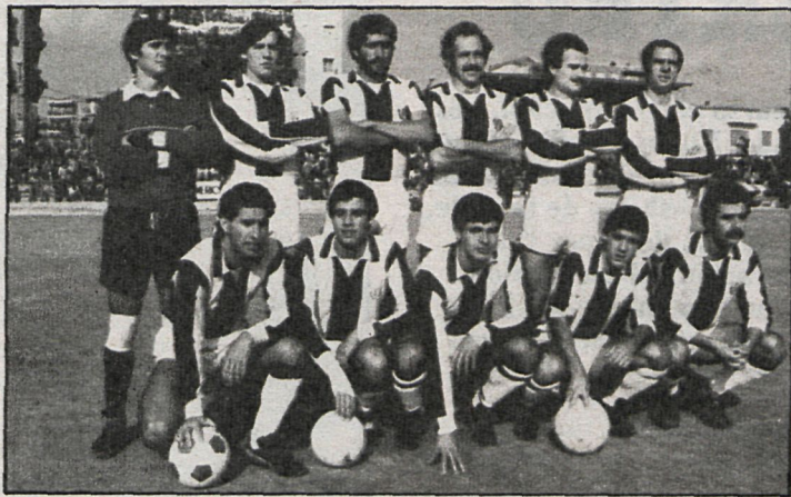
El Leganés, en la penúltima jornada del Campeonato, tiene la llave para decidir el triunfo de uno de los dos equipos más destacados

Es ésta la penúltima jornada de esta larga competición de Liga, y en ella, como ya es costumbre, cabe destacar tres encuentros: el Leganés-Parla, de suma importancia para los visitantes de cara a conseguir el campeonato; el Pegaso-Talavera, en el que los locales intentarán asegurar su actual posición que les permita en la temporada venidera disputar la Copa del Rey, mientras que los toledanos precisan la victoria para estar al acecho de un fallo del Parla que les encaramaría al primer puesto, y el duelo de auténtica rivalidad regional que han de disputar el Ciempozuelos-Atlético de Pinto, en el que los del Pinto necesitan cuando menos ganar un positivo para quedar a cubierto de cualquier contingencia desagradable.