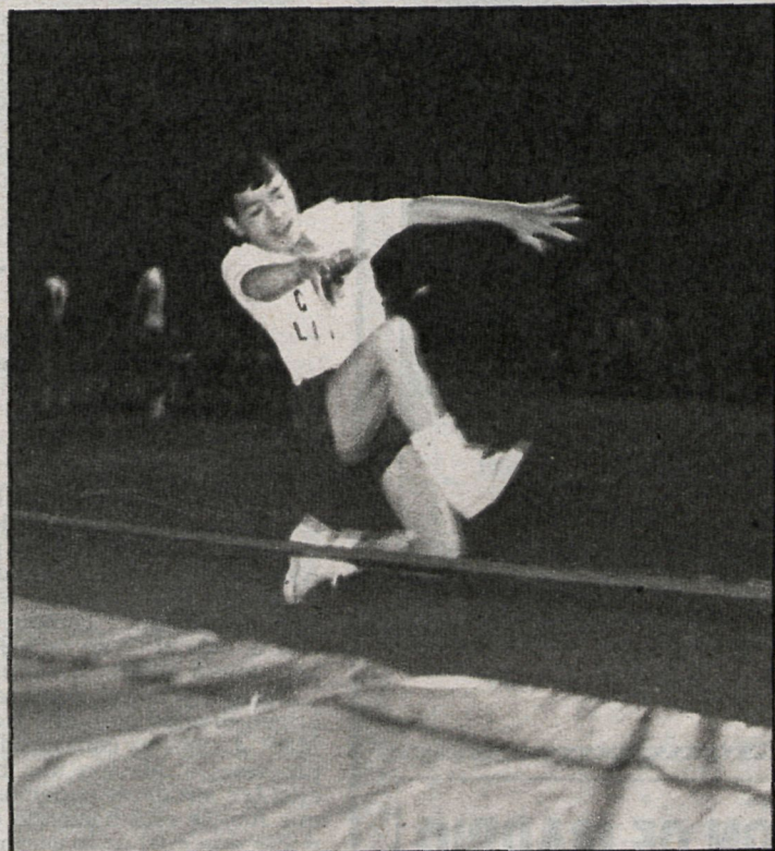
Los disminuidos psíquicos participan activamente en todas las competiciones que organiza ANDE

Por regla general, los estamentos oficiales se suelen comportar bastante bien con nosotros. Recibimos ayudas del CSD, del Instituto de la Juventud...; concretamente, el Ayuntamiento nos ha entregado 100.000 pesetas, al igual que