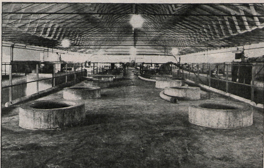
Bodegas de Villa del Prado, uno de los pueblos madrileños donde existen cooperativas vitivinícolas

Tienen renombre los vinos de San Martín de Valdeiglesias y su entorno con los pueblos de Cadalso de los Vidrios, Villa del Prado y Cenicientos. De las zonas de la provincia es la que más terreno tiene dedicado a este cultivo, unas 9.274 hectáreas. El terreno que es fundamental junto con la pluviometría para la calidad de estos caldos, está compuesto por silíceos con algo de granito y pizarra, lo que da una tierra suave. Las cepas predominantes son las Garnachas tinta y Albillo, junto Jaén y Malvasía en claro. En la elabora-