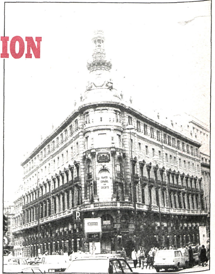
Madrid, donde hay «almacenado» un elevado volumen de recursos económicos, podría ser la comunidad-piloto en esta experiencia

tendrá una autonomía especial. Porque especial es su configuración como capital del Estado.