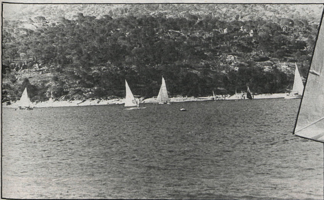
Este es el pantano de San Juan, ubicado en el término municipal de San Martín de Valdeiglesias, en una zona de gran belleza