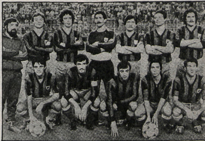
El Parla toca ya el título con la punta de los dedos

MOSCARDÓ-CONQUENSE. — En el Román Valero el