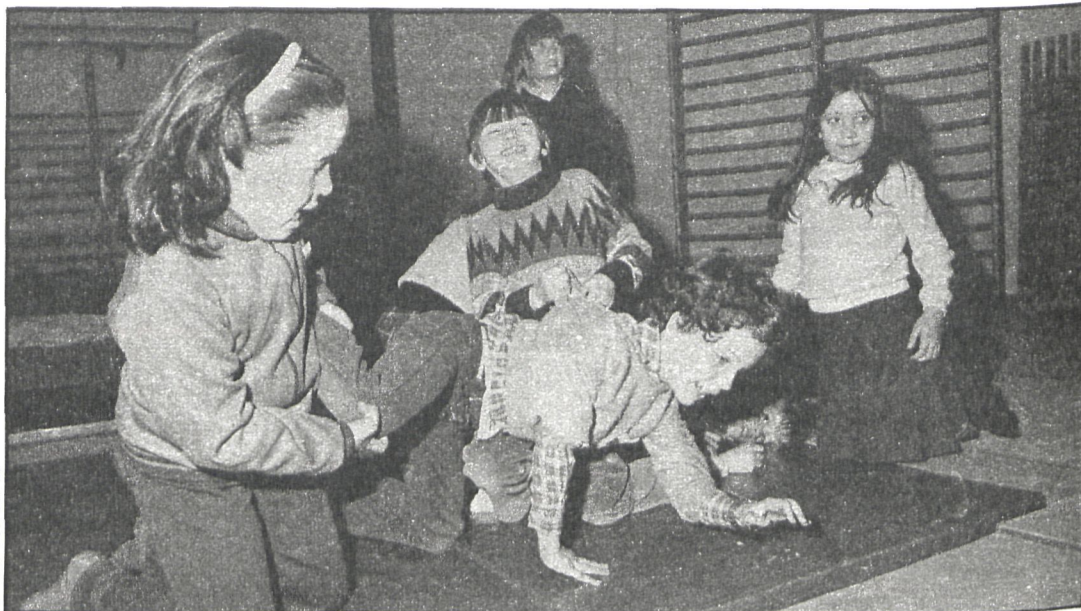
Los peques disfrutaban durante las clases: no se trata de formar actores, sino de que el niño se exprese y cree una imagen de grupo sin ningún tipo de competencia con sus compañeros