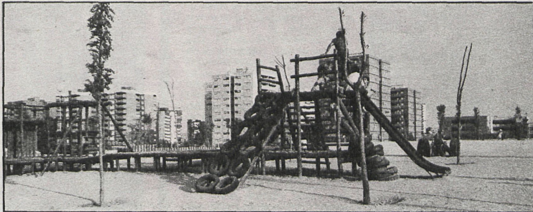
La Corporación de Coslada presta una especial atención al medio ambiente con la creación de parques como el Salvador Allende, que vemos en la fotografía

Finalmente, cabe destacar la política de obras en ejecución, como el centro socio-cultural de Ciudad San Pablo, el cementerio municipal, la urbanización del paseo Javier Saquilli, con acondicionamiento de un aparcamiento para doscientas plazas junto al apeadero y la reconstrucción de las calles Primavera, Salazar Alonso, Pablo Picasso y otras.