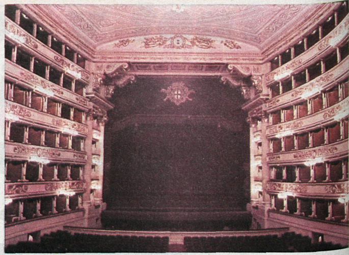
La Scala milanese ha contemplado siempre con admiración la ópera de óperas, con temas españoles y taurinos, "Carmen", de G. Bizet.

España ha de ser libre/ libre Castilla mientras haya en España/ manolería que todo chulo/ maneja la vihuela como el tabuco.