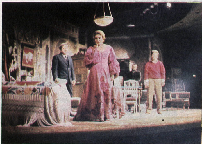
Antonio Gala, amante de los temas taurinos, hizo posible el milagro teatral de la perfección en "Petra Regalada".

El género musical aprovechará el tema taurino. Opera, zarzuela y revista picoteará, muy mucho, del toro, los toreros y sus amores. Folklore, melodrama y a veces oportunismo, como "En las astas del toro", zarzuela de Frontaura y Gaztambide, que aprovecha la cogida de Pepete por un miura y la "música". Otras veces el tema se bosqueja y queda como prendedor suelto que colorea una trama ajena. Los "caballeros en plaza" (rejonadores) de "La zapaterita" ameniza una noche de Carnaval en los Caños del Peral: