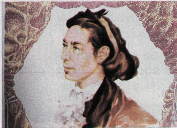
Pepe-Hillo, el mito de la Fiesta y el mito en el teatro.

"Pan y toros", símbolo de la revolución, sigue sin rehacerse de las tijeras de la censura. Isabel II, en su día, comenzó por cercenar el pasacalle que sirve de paseillo a los tres espadas. Décadas más recientes mantuvieron la condena en la grabación musical que hoy existe. El coro recurre siempre al primer cantable y olvida, como decidió Isabel II, aquello de: