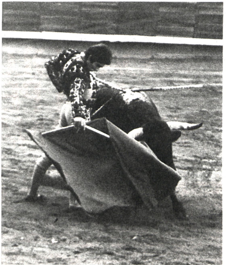
Rafael de Paula dejó pinceladas de su arte inimitable en las temporadas de 1979 y 1981. El jerezano cuenta en Madrid con apasionados seguidores.

Todo parece razonable, aparece la persona esperada