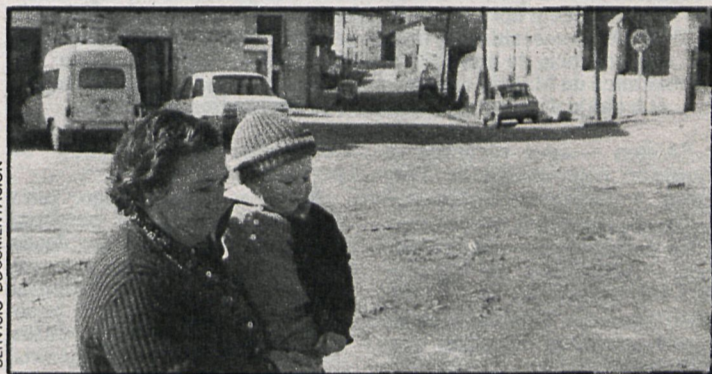
SERVICIO DOCUMENTACION Los informativos locales de Radiocadena pretenden enseñar a los vecinos de Madrid y provincia cómo funciona su Ayuntamiento

Radiocadena Madrid en los últimos meses ha ampliado el tiempo dedicado a la información local. Además de los boletines informativos ofrece tres espacios de media hora dedicados a Madrid y provincia: a las