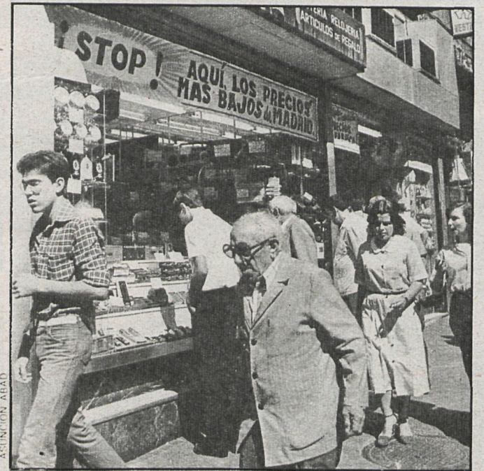
El Gobierno afirma que esta medida permitirá multiplicar los empleos en las pequeñas empresas

Lo mismo se hace con las figuras de contratación de trabajo en prácticas y para la formación de jóvenes trabajadores, así como con la de mujeres con cargas familiares, minusválidos y bonifica-