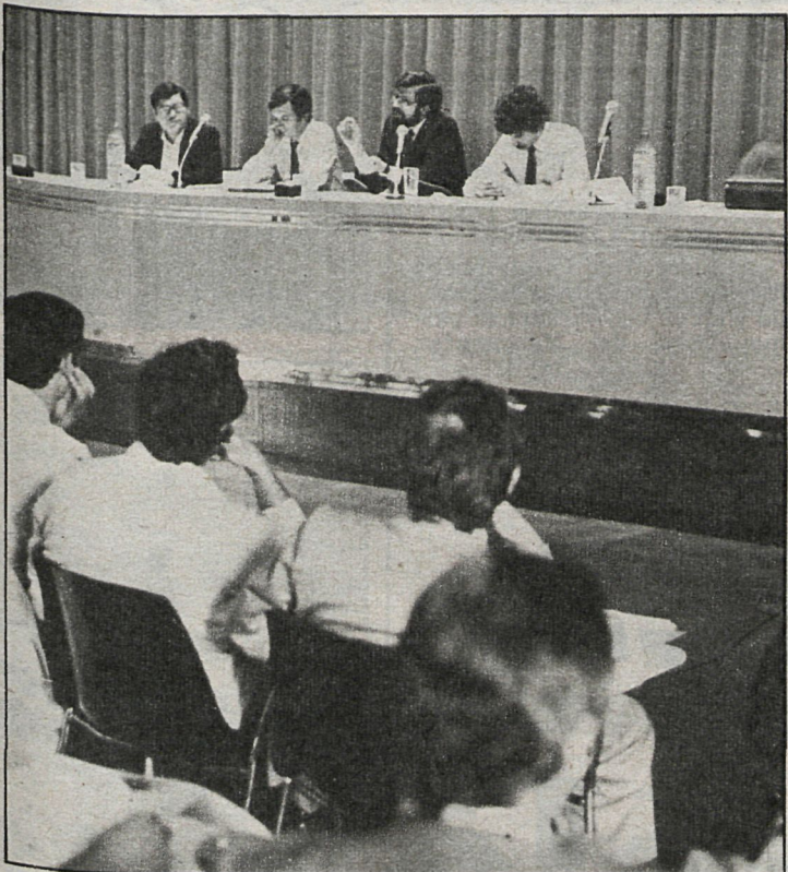
Expertos de toda España se dieron cita en el salón de actos del cuartel del Conde Duque para analizar los problemas de la Contribución Territorial Urbana, uno de cuyos momentos recoge la foto

Durante las I Jornadas sobre Contribución Territorial Urbana