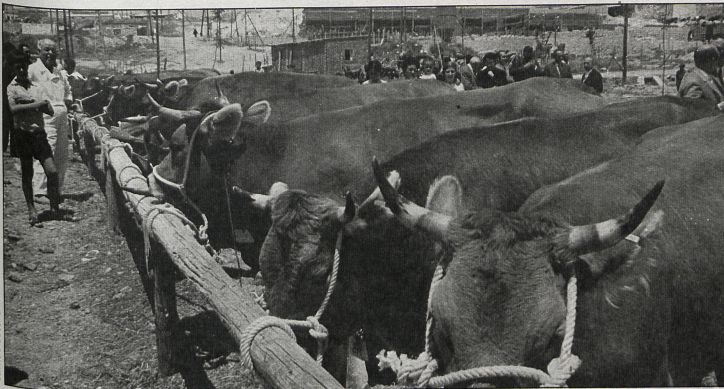
El Ayuntamiento de El Escorial quiere que su futuro mercado sea el enlace entre los de Asturias y Santander con los de Talavera la Reina y Avila

No existe ninguno en la región madrileña