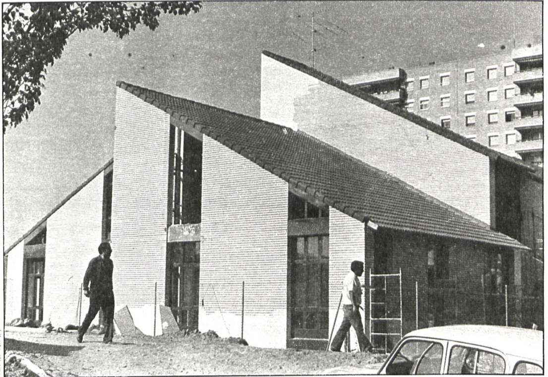
En muy pocos países europeos se ha realizado una experiencia semejante a la de Móstoles y en España es la primera

Las instalaciones del centro pueden dividirse en una zona infantil y otra para adultos. La zona infantil consta de una sala de juego y comedor, tres aulas o áreas de trabajo y juego y el pabellón de lactantes. Asimismo funcionará como guardería regular, tanto por las mañanas como por las tardes, e incluso podrán utilizar este servicio los padres que vayan a