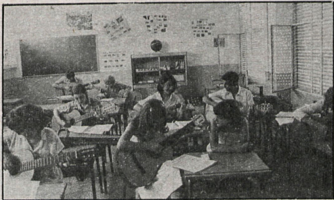
Con la puesta en marcha de la Universidad Popular, los vecinos de Parla tendrán un lugar donde aprender nuevas actividades o desarrollar sus aficiones

Hasta ahora el sistema para proceder a impartir una