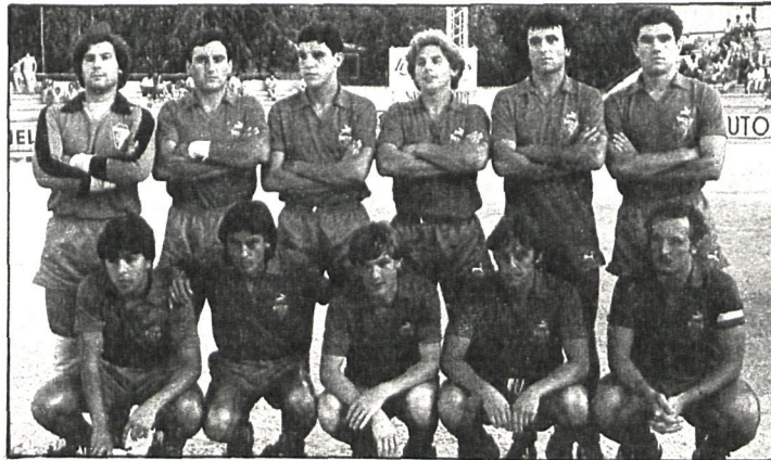
Conjunto del Aranjuez que, por el momento, va en cabeza de la clasificación

ARANJUEZ-MANCHEGO. — Los rojillos del Aranjuez, tras su última victoria a domicilio, conti-