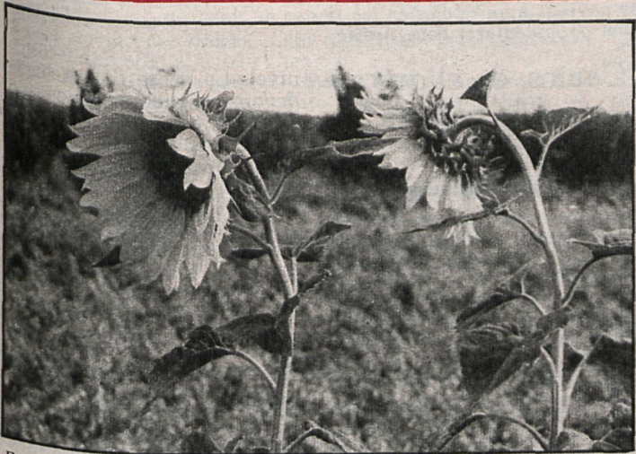
Este año, la cosecha de girasol prevista en Madrid es de 1.200 toneladas

Paralelamente a estas actuaciones, la comisión del SENPA que estudió el tema de la sequía también estudió la distribución de los 17.000 millones de pesetas en créditos, al 9 por 100, para abonos y fertilizantes y los 8.000 millones más, al 7 por 100, para semillas. En base a estas disponibilidades, se hicieron diferentes cálculos por hectárea, decidiéndose ampliar las cantidades a conceder. En Madrid, según la Dirección Territorial de Agricultura, las cifras a solicitar por hectárea son de hasta 3.500 pesetas para fertilizantes y 3.000 para semillas, al plazo de un año y al 9 por 100. La presentación de solicitudes se podrá hacer hasta el 31 de octubre. Sin embargo, estas cantidades señaladas por la Dirección Provincial es muy probable se amplíen a la vista de los recursos disponibles en el SENPA para estos conceptos y que se consideran más que suficientes.