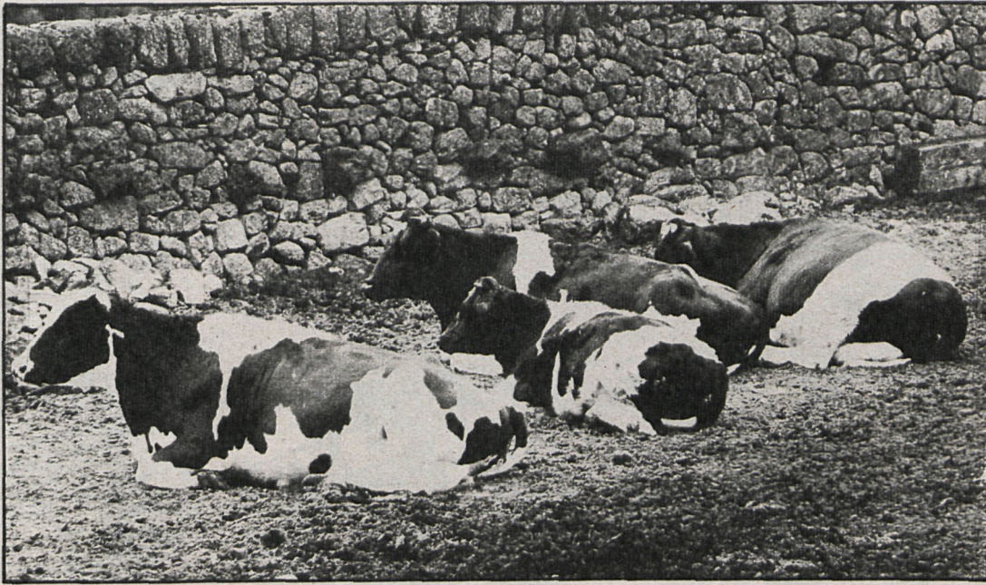
Los propietarios de ganaderías deberán efectuar sus pagos a finales de año

La medida forma parte de los compromisos adquiridos por la Administración para hacer frente a los efectos de la sequía