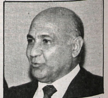
José Aranda, alcalde de Alcorcón

«En ella —afirma José Aranda— toda persona que lo desee recibirá asesoramiento en materia de precios y calidad de los alimentos, así como información sobre sus derechos. Pensamos que comenzará en noviembre a lo más tardar. Cualquier producto que se piense que está en malas condiciones podrá ser llevado a la