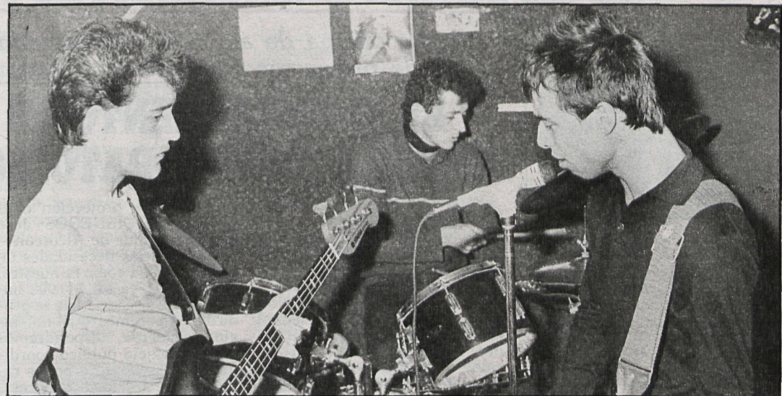
Todas las tardes, el grupo se reúne para ensayar. Tras el éxito obtenido en el concurso de «rock» provincial están decididos a encontrar «un lugar bajo el sol» del mundillo musical