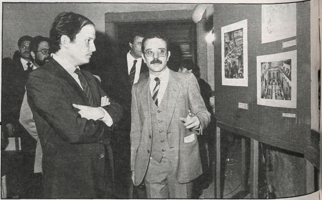
El presidente de la Diputación, señor Rodríguez Colorado, recorrió las salas interesándose por distintos aspectos de la exposición

que no cabe duda de que ciertas empresas culturales necesitan un desembolso económico importante. Y en este sentido, el espíritu del documento suscrito allanará muchos problemas que de otra forma tendrían difícil solución.»