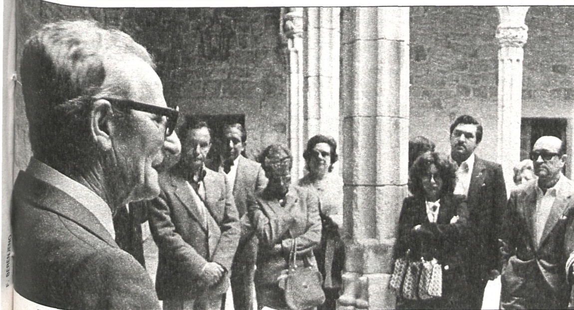
El vicepresidente Sócrates Gómez durante la recepción ofrecida en el castillo de Manzanares a los alcaldes iberoamericanos