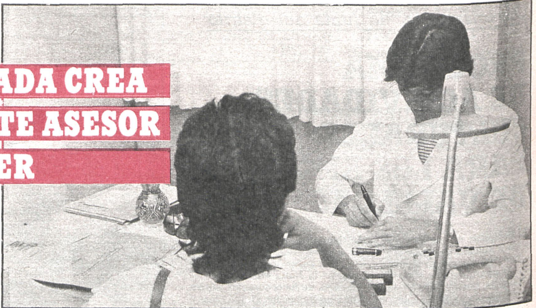
El nuevo Gabinete Asesor de la Mujer de Fuenlabrada viene a sumarse a los existentes en otros municipios

Se le orienta también sobre la legislación dictada en la época ac-