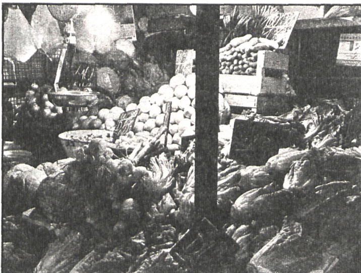
Aparte de la oficina, pronto entrará en funcionamiento el Consejo de los Consumidores y Usuarios, para una mejor defensa de los intereses de los ciudadanos en este terreno

Hay también, por último, un gabinete de asistencia psicosocial y familiar, integrado por un psiquiatra y un psicólogo. Cuenta con la colaboración de la asistente social del centro y de una socióloga que colabora en tareas de investigación. Se trabaja en tres frentes, como son las actividades asistenciales: psicoterapias de familia, de grupo, individuales y consulta psiquiátrica; la promoción de la salud comunitaria y la investigación.