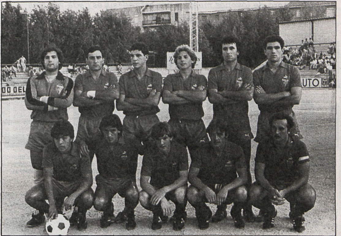
Formación actual del Aranjuez

TARANCON-AT. MADRILEÑO. — Los mini rojiblancos no consiguen salir del grupo de los hundidos y acusan en exceso su falta de veteranía; ahora su próxima dificultad se llama Tarancón, y nos tememos muy mucho que no van a ser lo suficientemente «jabatos» como para regresar con positivos de la bella localidad conquense.