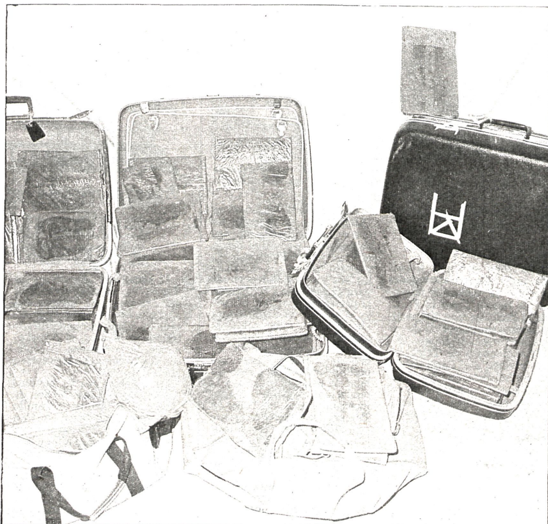
Pese a la frecuente captura de alijos de droga, el tráfico no desaparece