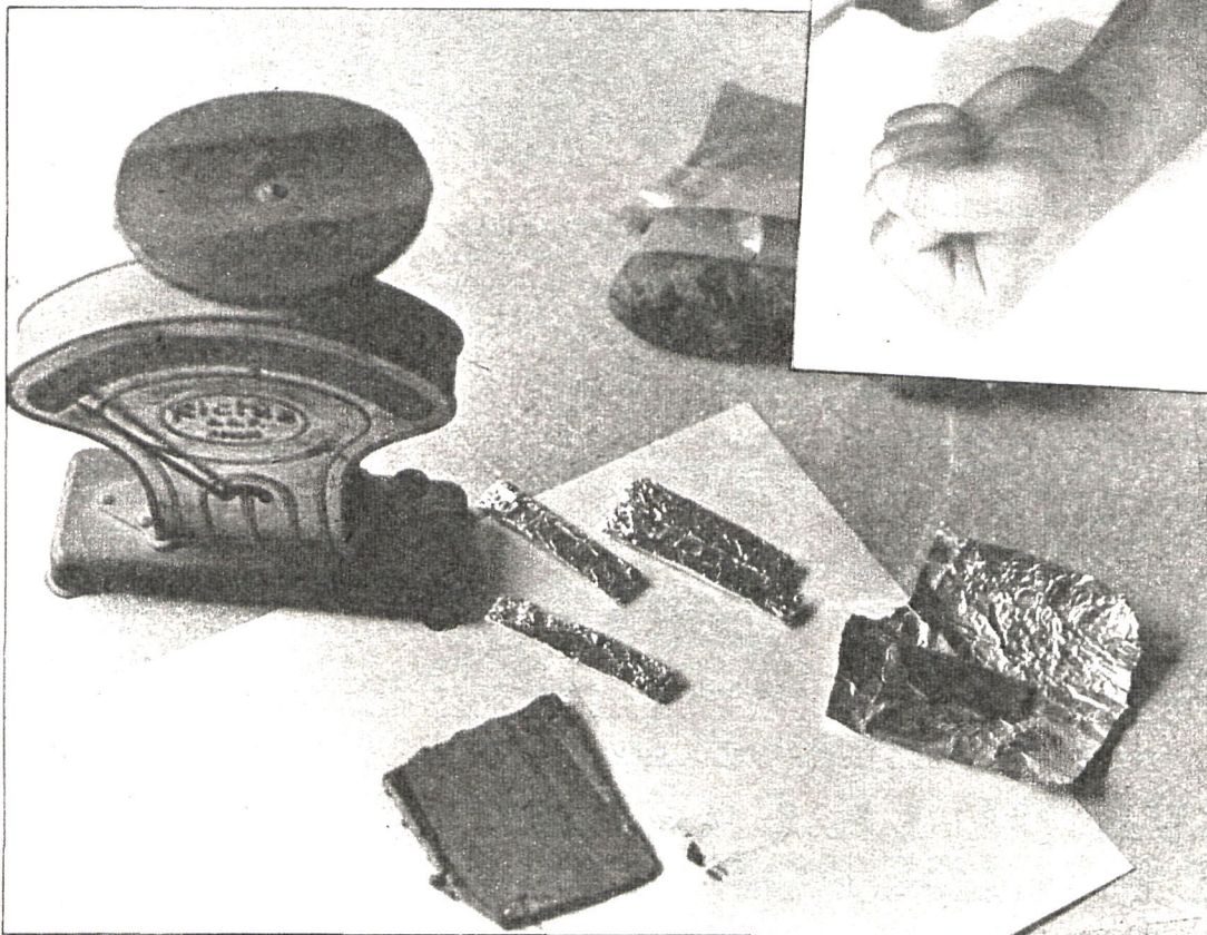
La adulteración de la droga es causa de numerosas muertes

Teniendo en cuenta que el gramo de «caballo» se vende alrededor de las 25.000 pesetas, no es difícil imaginarse la magnitud del negocio que puede moverse en torno a esa palabra llamada «heroína». Sobre la entrada en nuestro país de tal producto y sobre sus canales de circulación poco se sabe. De vez en cuando en alguna redada cae algún «camello» de poca monta, pero de los grandes «capos», de los cerebros planificadores nunca se consigue saber nada.