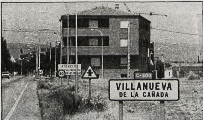
Los vecinos de Villanueva tienen a su disposición cuatro pistas de tenis, dos polideportivos, tres piscinas y un campo de fútbol con vestuarios

Hay pueblos dentro de nuestra región que nunca han tenido posibilidad de hacer deporte en otro sitio que no fuera un mal campo de fútbol o una acera. Este era el caso de Villanueva de la Cañada, un pueblo pequeño, pero sin posibilidad de realizar actividades deportivas en un marco apropiado. Ahora todo es distinto desde que este verano se inauguró el polideportivo Santiago Apóstol