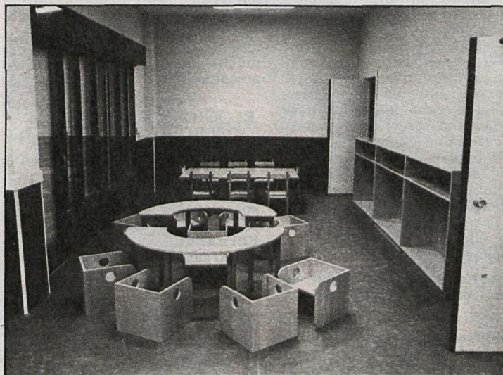
La escuela infantil tiene capacidad para 250 niños