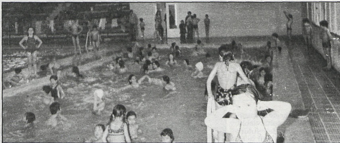
El 25 por 100 de los vecinos practica algún deporte. En la foto, la escuela de natación