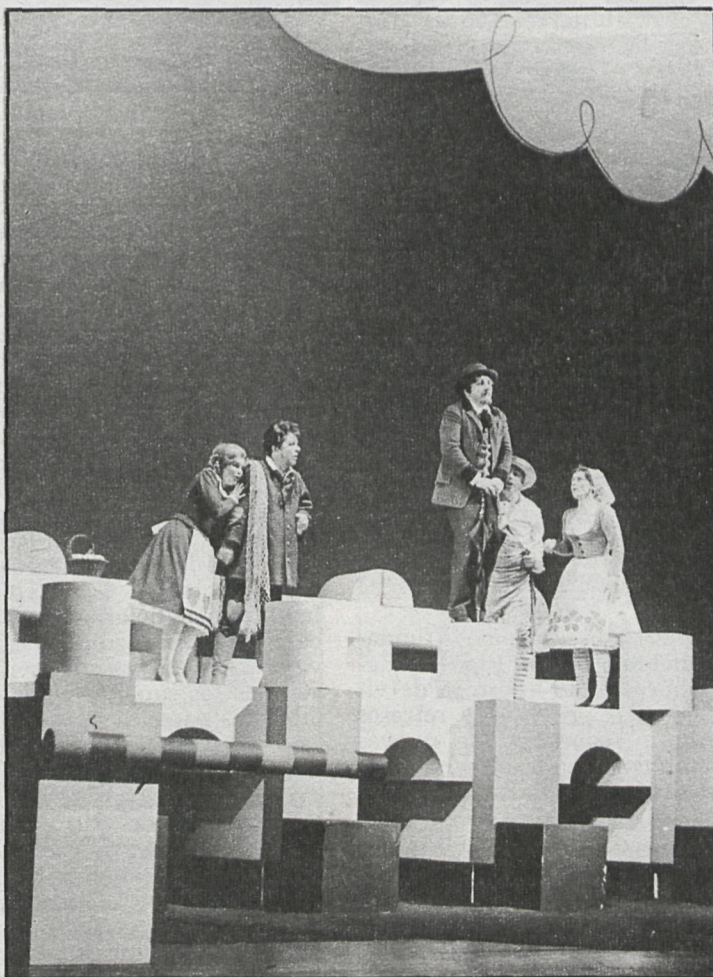
El teatro es parte importante de la semana cultural

También en Pozuelo de Alarcón, la asociación juvenil El Guá acogerá a todos aquellos interesados en el conocimiento y la práctica del yoga, previo pago de una matrícula de precio popular, 100 pesetas. La información se da en los locales de la Asociación a partir de las siete de la tarde, los lunes, martes y jueves.