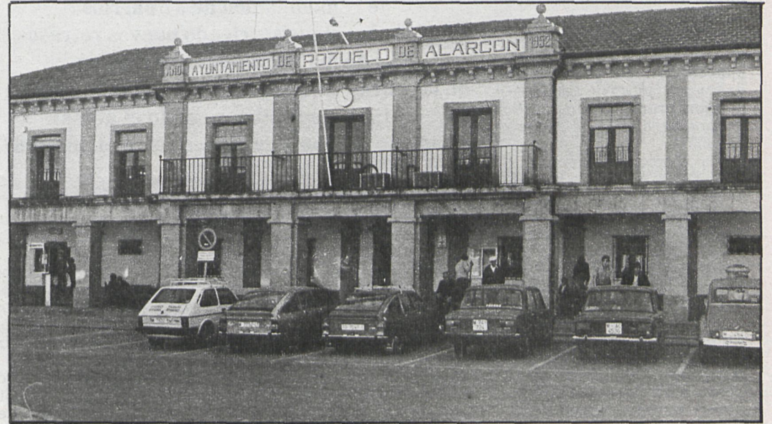
El Ayuntamiento de Pozuelo está haciendo grandes esfuerzos por potenciar la cultura en el municipio

El programa comenzó con «Boda gitana», con música de Paco de Lucía, partiendo del jazz con libre movimiento del cuerpo e intercalado con matices gitanos; continuaron con el «Concierto número 2», de Di-