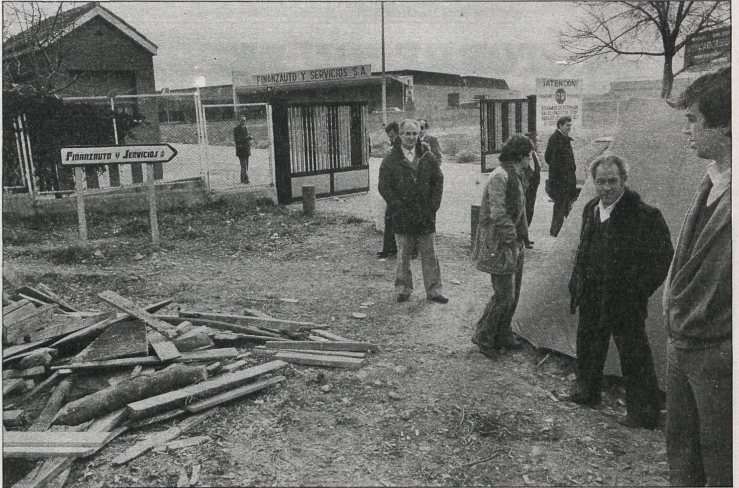
Los trabajadores se mantienen expectantes ante su situación laboral

Esta es una vieja y complicada aspiración de la mayor parte de los ayuntamientos españoles, que en el caso de Arganda se ha resuelto a través del estudio dialogado.