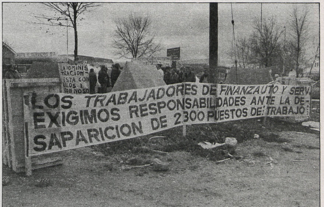
Numerosas pancartas rodean la fábrica

Desde que la dirección de la empresa se negó a negociar con los trabajadores, se han repetido varios actos de protesta.