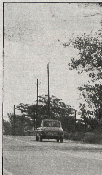
Cruzar la carretera en los alrededores de Los Negrales va a dejar de ser un peligro

constituyen la dehesa Boyal, son también propiedad del Ayuntamiento de Alpedrete y debo declarar y declaro la nulidad del acta de deslinde efectuada por este juzgado el día 31 de enero de 1980, por la que se deslinda la finca de las Cercas de Avila. Así como la inscripción registral que de dicha acta se efectuó en el Registro de la Propiedad, condenando a los demandados a estar y pasar por esta declaración y sin hacer expresa imposición de costas a ninguna de las dos partes litigantes».