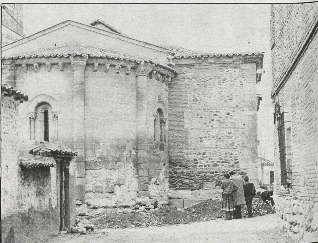
Aún se conserva la cabecera románica como único resto del primitivo templo

El proyecto de restauración señala como daños más importantes los provocados por humedades motivadas tanto por defectos en la cobertura como por absorción del subsuelo: «La blandura de la piedra caliza de los muros exteriores afecta principalmente al ábside, constituyendo esta zona la parte más preocupante al haberse deteriorado no sólo la sillería, sino también elementos arquitectónicos como bases, capiteles y cornisas.» En consecuencia, las obras se dirigen a evitar las