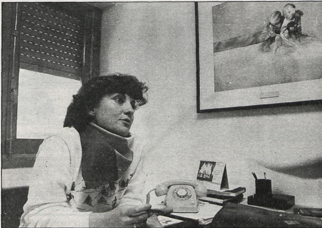
La concejala de Sanidad de Leganés habló para CISNEROS sobre su área.

Se tendrán en cuenta diversos factores que inciden de alguna forma en estas dos enfermedades, como es el caso de la edad, entre los treinta y cinco y cincuenta años, en el caso de cáncer de útero, así como la situación social deprimida y la multiparidad. En el cáncer de