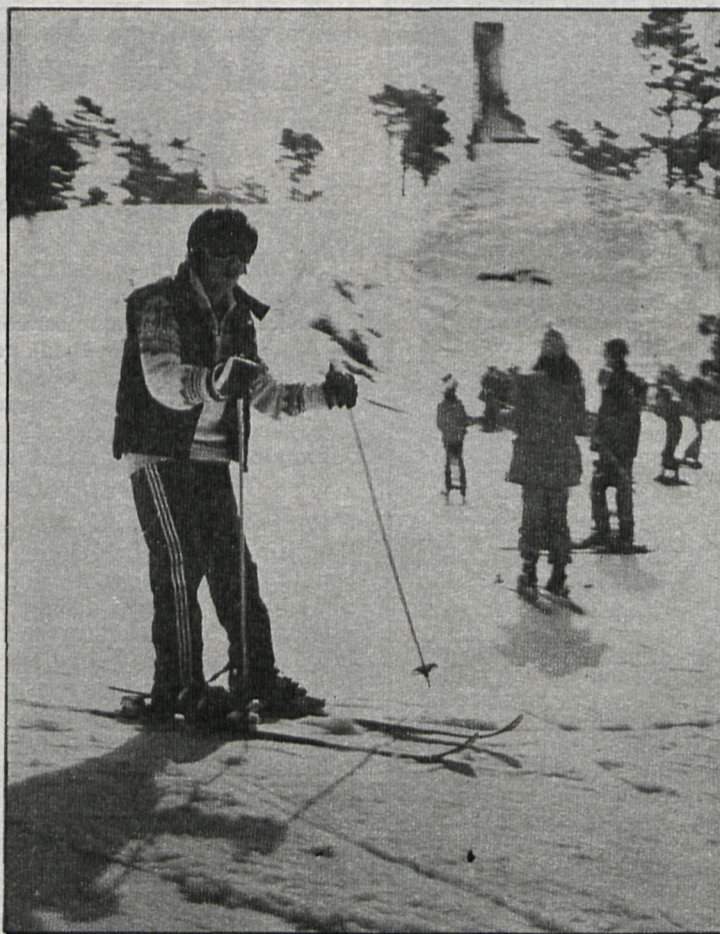
Durante los días que duran los cursillos los muchachos aprenden a esquiar, conviven y reciben formación sobre la naturaleza