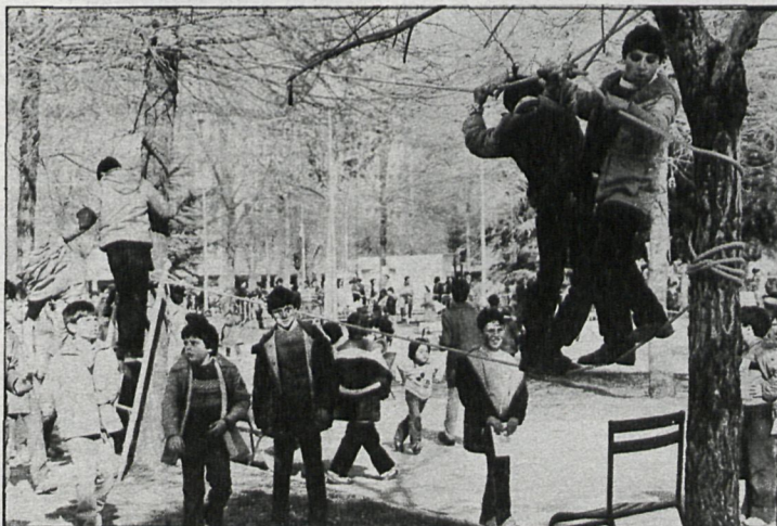
Las entidades organizadoras del festival pusieron a disposición de los niños numerosas actividades, tanto creativas como recreativas