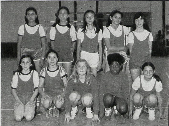
En El Escorial también hay un equipo alevín de baloncesto femenino, que vemos en la fotografía