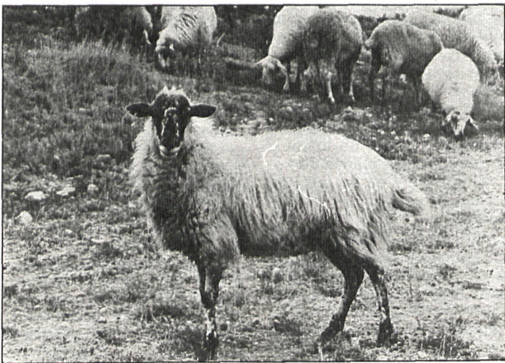
Las campañas se realizan tanto en el ganado vacuno como en el ovino y caprino

La economía de la sanidad animal está en sus inicios en la provincia, y en los últimos años ha cobrado un gran impulso con el objetivo de conseguir la mayor rentabilidad, disminuyendo los costes de producción mediante la erradicación y el control de los procesos infecciosos.