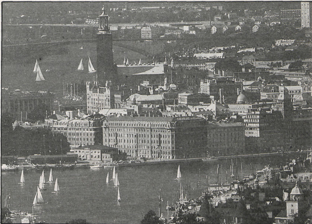
La hermosa ciudad de Estocolmo, escenario del de la Unión Internacional de Autoridades Locales

Se celebrará del 19 al 23 de junio en Estocolmo