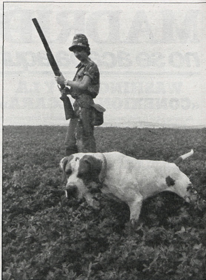
Las escopetas sonarán menos a partir del mes que viene

«Es necesario que se realice una buena infraestructura deportiva, común para todos los pueblos de la sierra»