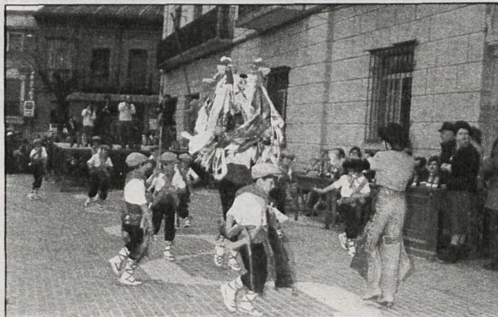
La foto corresponde a Colmenar Viejo, municipio donde, al igual que en Pedrezuela, también se celebra la Fiesta de la Vaquilla

Otro de los factores que ha contribuido a la desaparición de la fiesta en numerosos municipios ha sido el despoblamiento y la consiguiente falta de jóvenes. Al tener que vestir a la vaca los quintos de cada año, se ha dado, en ocasiones, la circunstancia de no existir ninguno en edad militar.