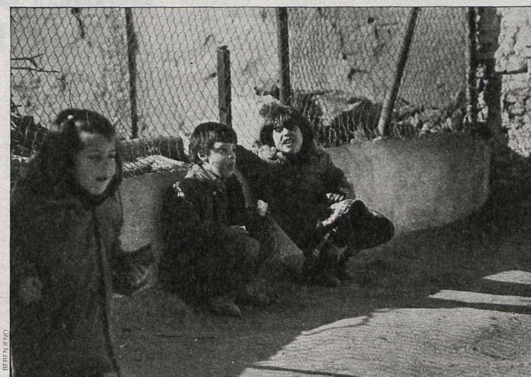
Los niños disminuidos tienen un buen nivel de integración social en un ambiente natural donde participan en todas las actividades que se organizan para los alumnos

que componen la plantilla del centro, cada uno de ellos se hace responsable de un grupo de 25 alumnos, que también cuentan con profesores especiales de plástica, de expresión dinámica, de deportes y de idiomas a partir de una determinada