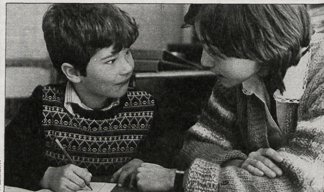
Se prescinde de exámenes y de libros de texto concretos, haciéndose unos planteamientos de investigación divertidos y con mucha participación

en la primera etapa de básica no suspendemos a ningún alumno aunque haya hecho un curso malo; nos parece más importante ayudarle a superar sus dificultades que limitarnos a que unos repitan y otros no».