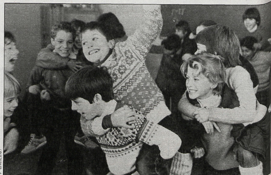
Los 440 alumnos que integran el colegio deciden la actividad escolar y aportan su propia experiencia infantil y sus curiosidades