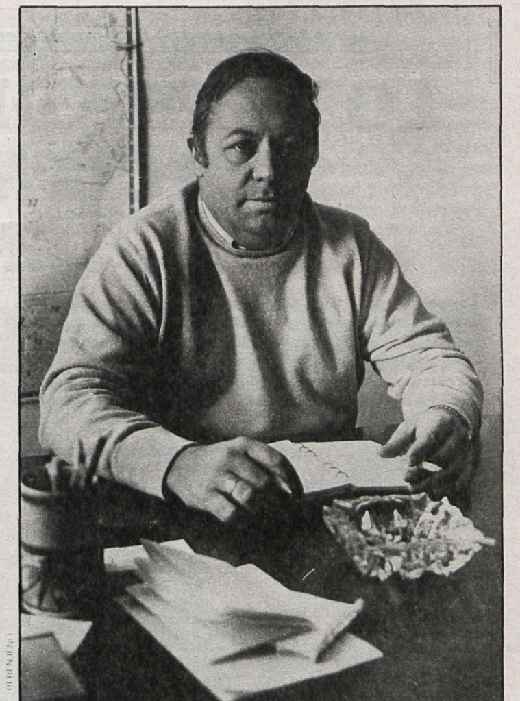
El director del centro y delegado para España de la Asociación Internacional de Jóvenes Educadores de Niños Inadaptados ve muy bien la integración de los deficientes con el resto del alumnado