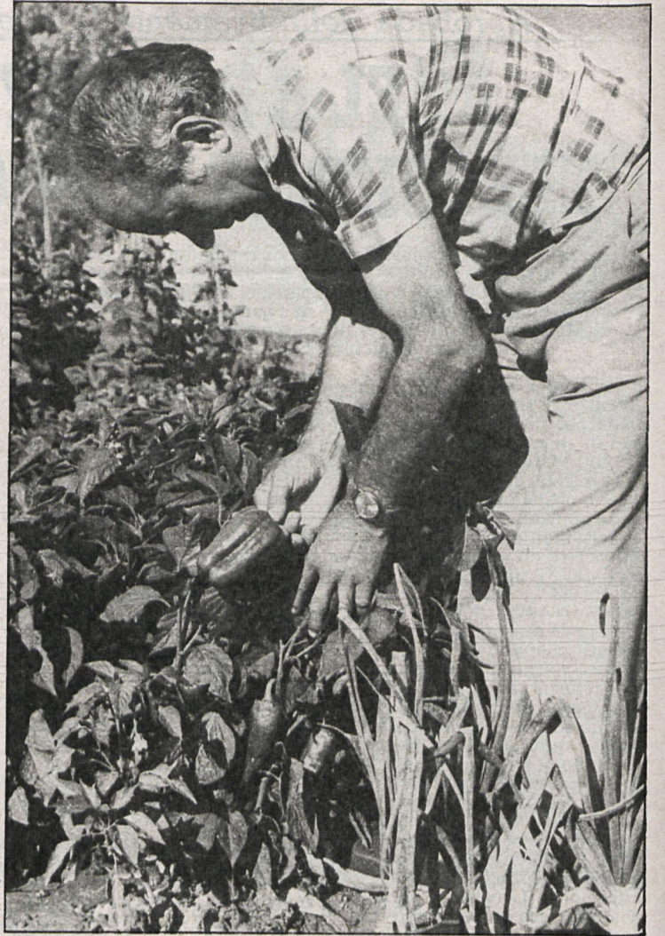
El aumento de la producción hortícola ayudó a mantener estacionaria la producción agrícola ante la baja producción de cereales

Un año más la agricultura provincial ha perdido renta en producción, y éste es el primer paso para el endeudamiento del campo.