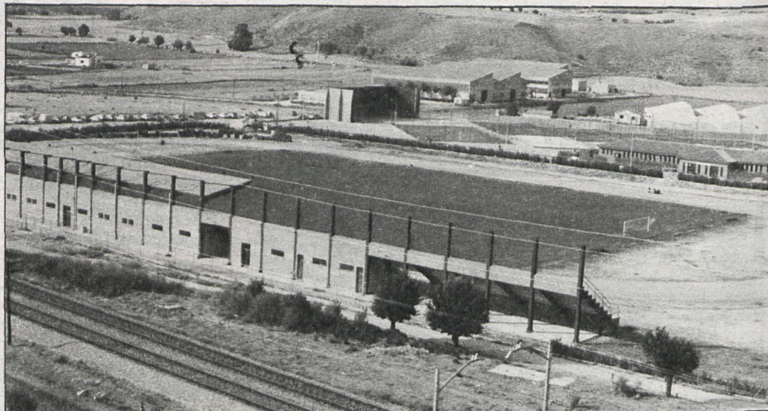
El campo de fútbol del polideportivo de Valdemoro tiene graderíos para 6.000 personas