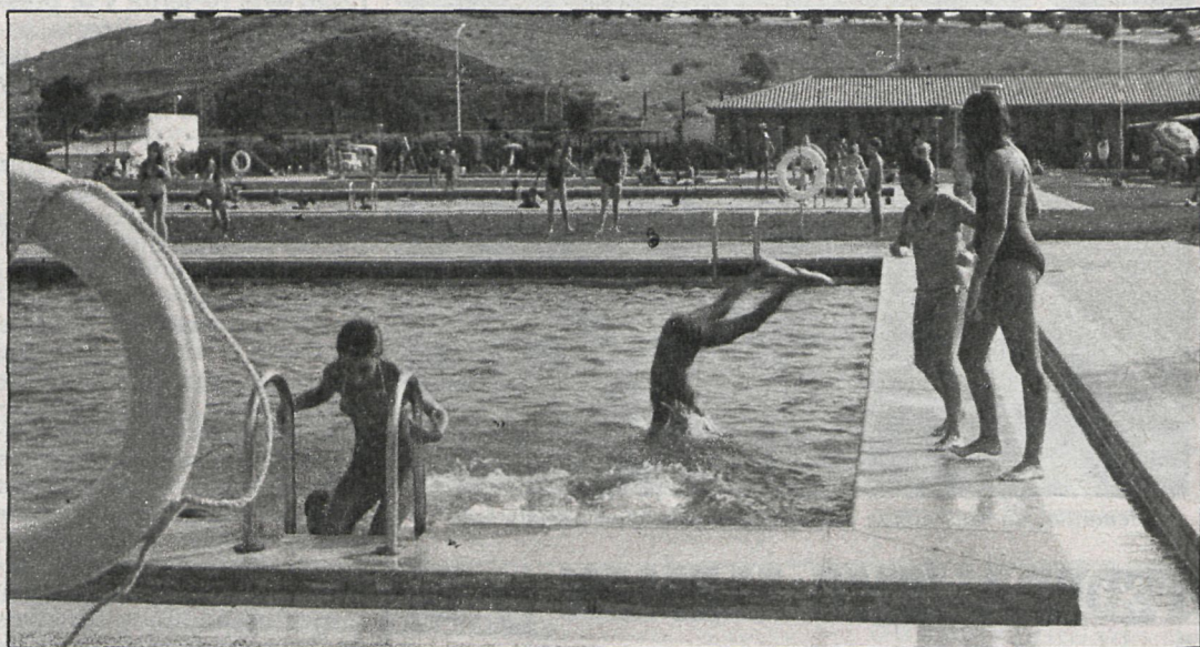
Más de 1.000 niños han acudido a las piscinas municipales durante los cursillos de natación

cionan al ciento por ciento de su capacidad. Esto nos ha llevado a traer un nuevo profesor de educación física y tres monitores.»