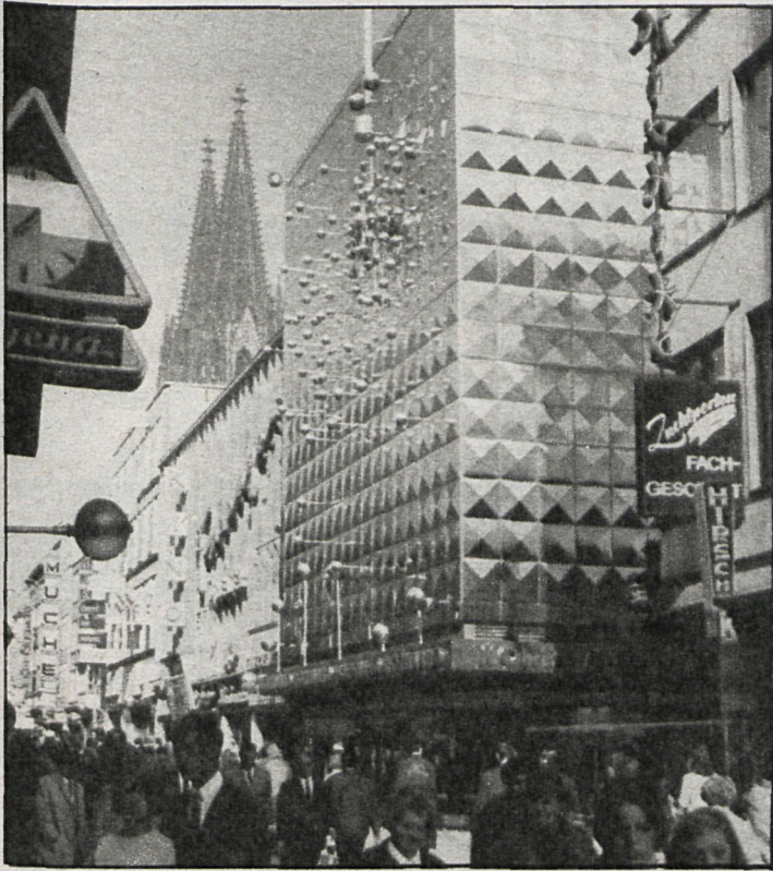
Alemania, un país donde el ciudadano participa activamente