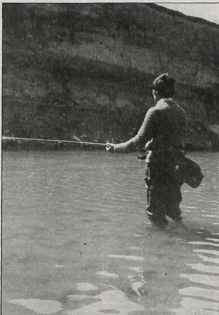
Pescando el barbo en Talamanca del Jarama