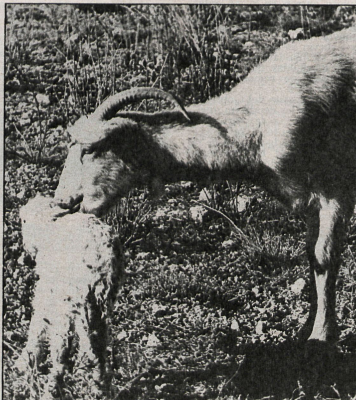
Los cruzamientos indiscriminados, la incidencia de las enfermedades y el olvido han sido los motivos principales para que esta especie esté disminuyendo progresivamente

conjuntamente entre el Ministerio de Agricultura y la Diputación. Para mejorar la calidad de los rebaños de cabras, la Diputación está formando núcleos propios, para posteriormente distribuir entre los ganaderos los sementales seleccionados. En la actualidad hay un núcleo de 200 cabras de pradera —granadina y mur-