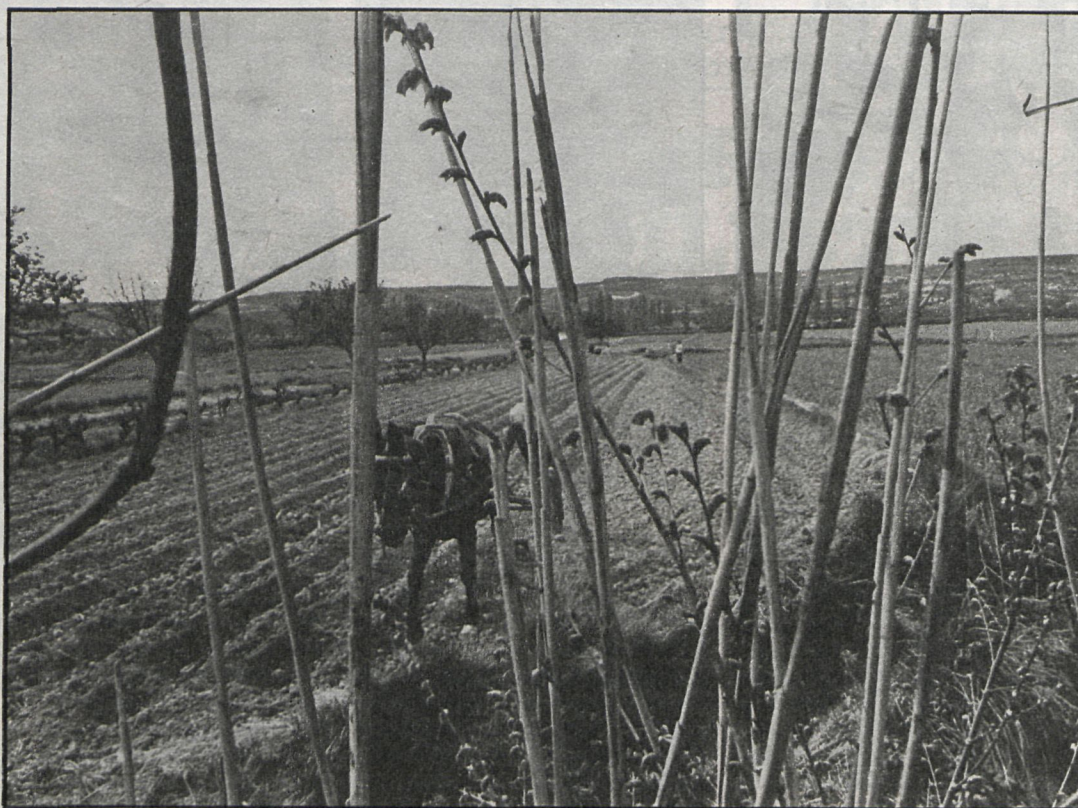
La ley de contratos agrarios defenderá tanto a agricultores como a compradores

La distribución de los pastos comunales provocó enfrentamientos