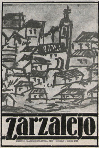
zarzalejo NUESTRO CUADERNO CULTURAL. AÑO I, NÚMERO I, FEBRO 1983

otros objetos de valor histórico de la edad del bronce, lo que confirmaría a Zarzalejo como uno de los pueblos más antiguos de la región. Los restos se encontraron en la ladera de La Machota, al norte del barrio de la estación. La información es muy interesante por los datos que aporta, y según parece éste va a ser tema de varios artículos que aparecerán en el cuaderno cultural.