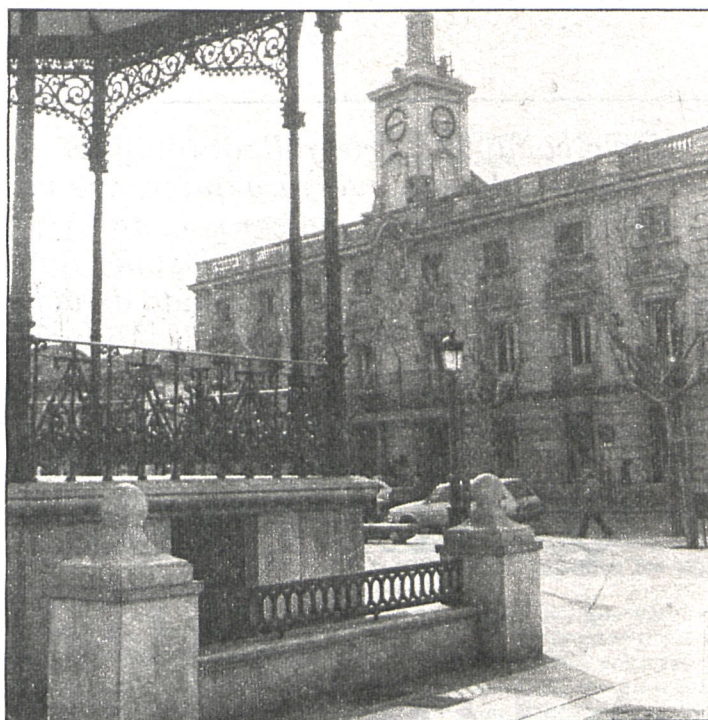
El Ayuntamiento aprobó las normas subsidiarias, modificadas con los votos favorables del PSOE, PCE y PTE y la abstención de UCD

Según Genoveva Christoff, los planes de urbanismo expresan la voluntad política de un Ayuntamiento, y los vecinos de una ciudad están representados por la corporación local, es decir, que si una asociación de vecinos o los técnicos de un