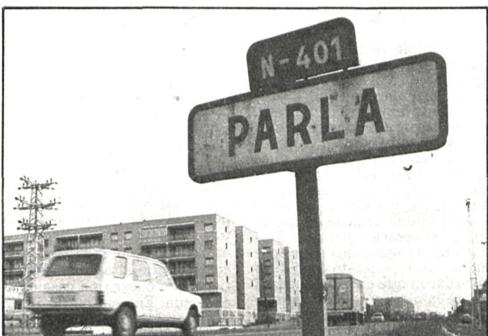
El encuentro de los responsables municipales de cultura de la zona sur de Madrid con el ministro tuvo lugar en Parla

No es la primera vez que Javier Solana visita los municipios de la zona sur de Madrid, cuya problemática conoce en profundidad. Recientemente inauguró un colegio en Alcorcón y aprovecha cualquier oportunidad para mantener contacto con los vecinos y autoridades de esta área, en la que habita una gran parte de los ciudadanos de la región.