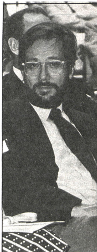
Javier Solana, ministro de Cultura

Javier Solana puso de manifiesto su buena disposición a colaborar en la resolución de todos estos problemas y señaló que a través de la comunidad autónoma de Madrid se podrán satisfacer en mayor medida todas estas aspiraciones.