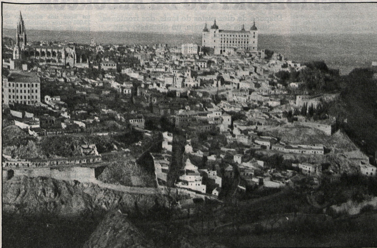
La monumental ciudad de Toledo es la sede de la autonomía de Castilla-La Mancha