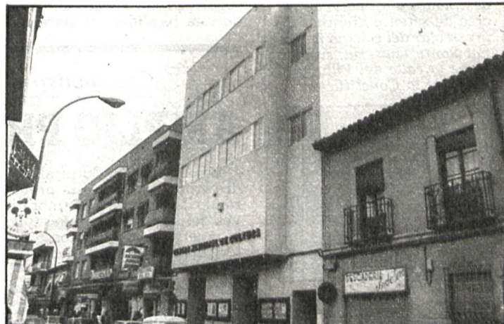
Los interesados en este certamen literario deberán enviar sus trabajos a la Casa Municipal de la Cultura

6.º Los trabajos serán presentados por triplicado, escritos a máquina y a doble espacio, en tamaño folio, por una sola cara.