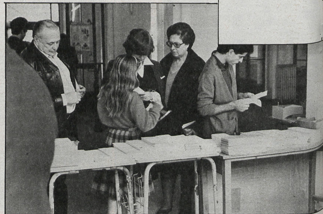
Esta imagen —tomada el 28-O— volverá a reproducirse el próximo día 8 de mayo

El viernes 25 de marzo el comité federal del PSOE aprobó definitivamente las listas de 550 municipios de más de diez mil habitantes, entre los que se encuentran varios pueblos de la región madrileña, la lista para la capital ya estaba asegurada desde varios días atrás, y en ella no se han producido variaciones con la que publicó CISNEROS hace tres semanas. Tan sólo resaltar el acuerdo producido recientemente entre el secretario general de la Fe-