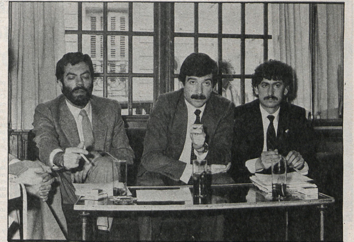
Gerardo Iglesias, secretario general del PCE, presentó oficialmente las candidaturas al Ayuntamiento y al Parlamento Regional

“ La Villa de Madrid, por su condición de capital del Estado y sede de las instituciones generales, tendrá un régimen especial, regulado por ley votada en Cortes. Dicha ley determinará las relaciones entre las instituciones estatales, autonómicas y municipales, en el ejercicio de sus respectivas competencias. (Estatuto de Autonomía de Madrid. Artículo sexto.) ”