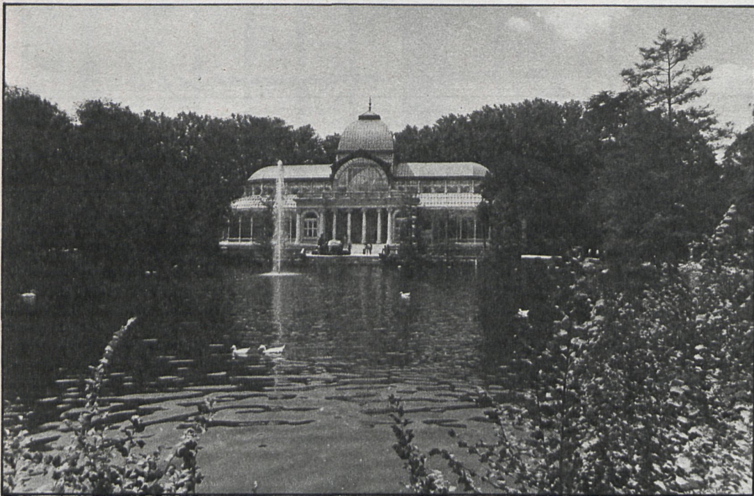
La Asociación de Amigos del Retiro ha sido la promotora de las jornadas organizadas por la Junta municipal del Retiro

Han estado dirigidas fundamentalmente a los escolares de la zona